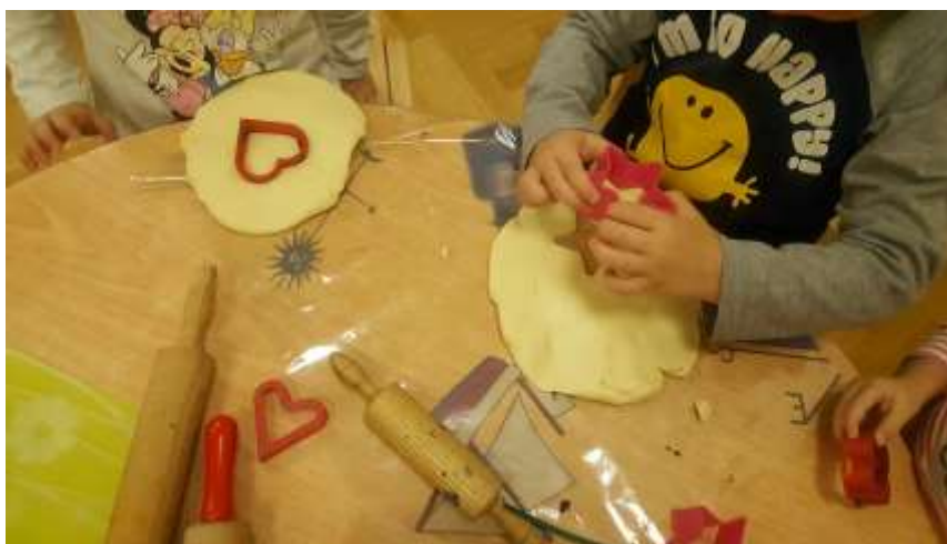
Slika 21. Utiskivanje modlica u slano tijesto

S mlađom djecom je potrebno raditi na usvajanju pravilne upotrebe modlica, zato što pokazuju teškoće u odvajanju otisnutog oblika.