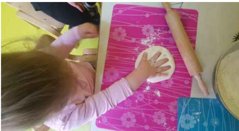
Slika 15. Prikaz ruke u slanom tijestu