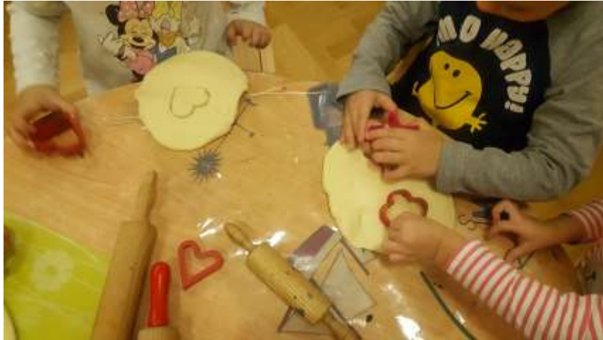
Slika 22. Prikaz rezanja oblika uz pomoć modlica