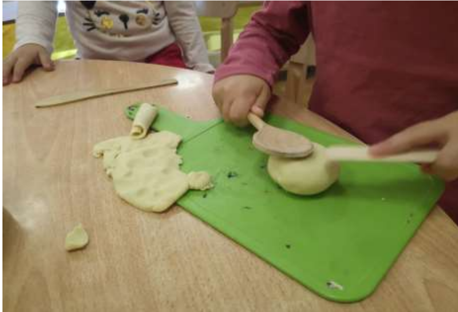
Slika 6. Djevojčica odlučuje udarati tijesto