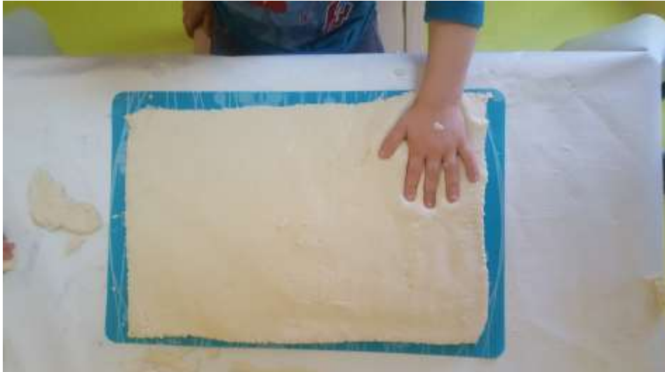
Slika 13. Otiskivanje dlana na velikoj masi slanog tijesta