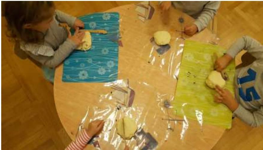
Slika 10. Utiskivanje prstića u slano tijesto