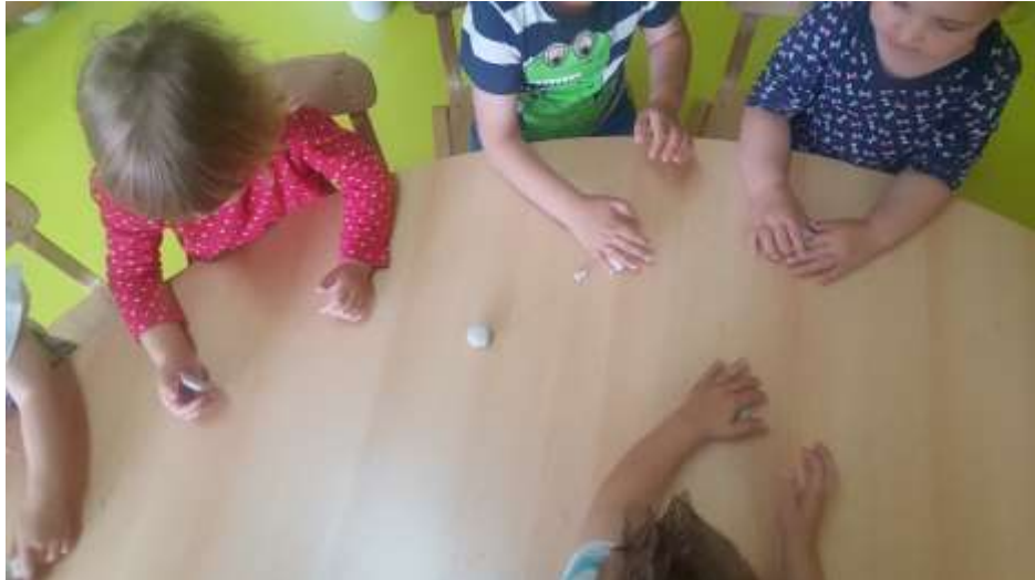
Slika 24. Prikaz kuglica od tijesta