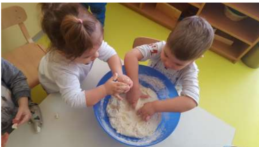
Slika 5. Izrada slanog tijesta