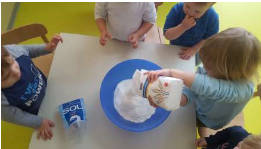
Slika 2. Dodavanje brašna