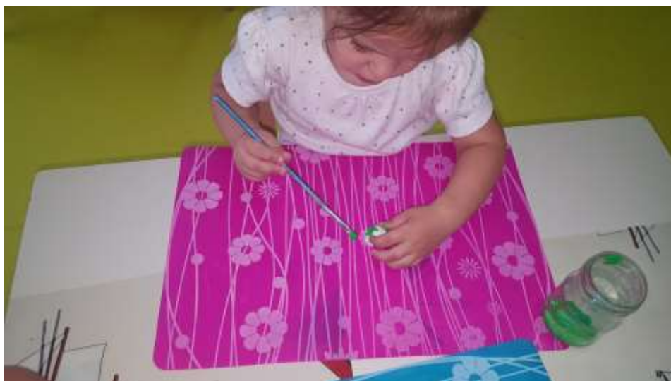
Slika 29. Djevojčica ne odustaje od aktivnosti, usmjerava pažnju na bojanje