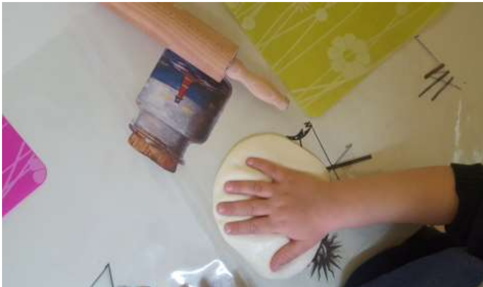
Slika 14. Otisak dlana u manjoj masi slanog tijesta