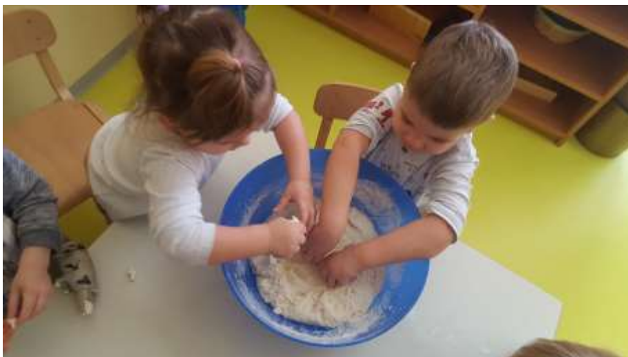
Slika 4. Miješanje svih sastojaka