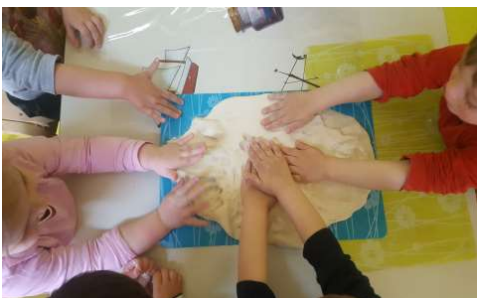
Slika 17. i 18. Pridruživanje djece u aktivnost