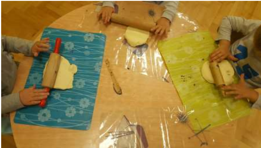
Slika 7. Pokušaj valjanja tijesta uz pomoć valjka