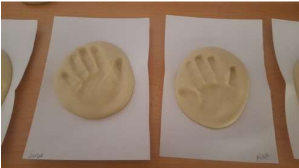
Slika 19. i 20. Otiska dlana nakon što se osušio