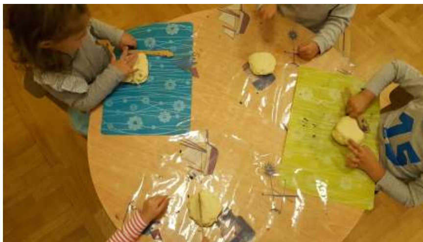
Slika 9. Ravnanje tijesta s drvenim nožićem

Rezali su tijesto drvenim nožićima. Mlađoj djeci je bilo lakše razdvajati tijesto s rukama nego koristiti se s nožićem. Dok su tijesto razdvajali rukama primjetila sam da su se jako iznenadili kada su ugledali tijesto u desnoj pa u lijevoj ruci. Zatim su tijesto spustili na stol i počeli ga modelirati.