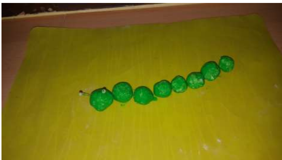
Slika 30. Prikaz gusjenice