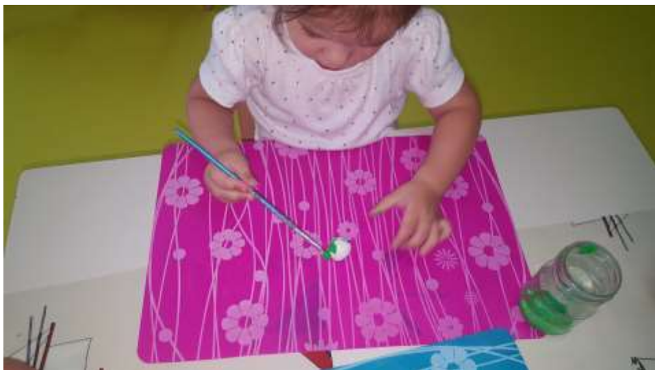
Slika 27.i 28. Djevojčice L.Č.i L.G. skoncentrirane su na sami proces rada