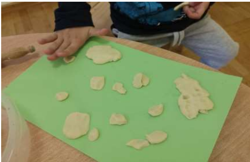
Slika 11. Pritiskanje tijesta s dlanom