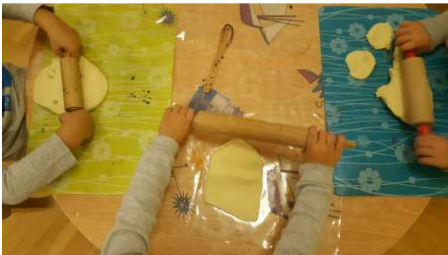
Slika 8. Prikaz valjanje tijesta (naprijed-nazad-naprijed-nazad)