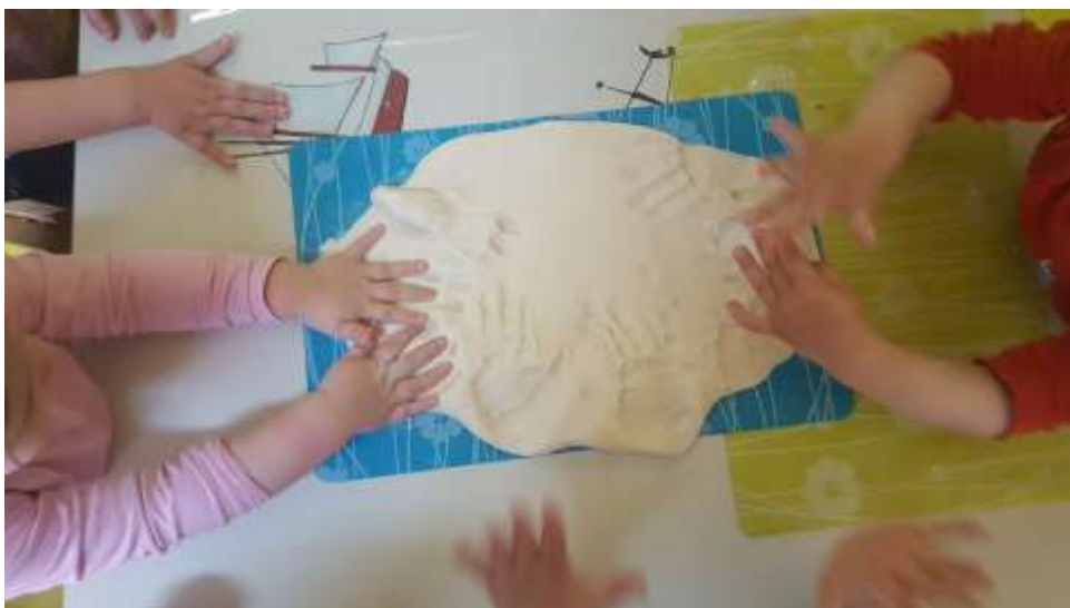
Slika 16. Zajednička aktivnost otiskivanja dlana