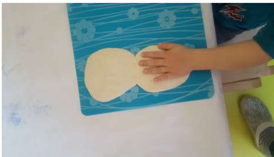
Slika 12. Pokušaj otiskivanja dlana u tijesto

Djeca pokazuju oduševljenje pri ponovom spuštanju ruke u svoj otisak, ali isto tako pokazuju iznenađenje kada su opipali tijesto koje više nije mekano već tvrdo.