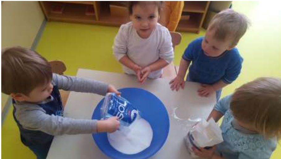
Slika 1. Istraživanje sastojaka