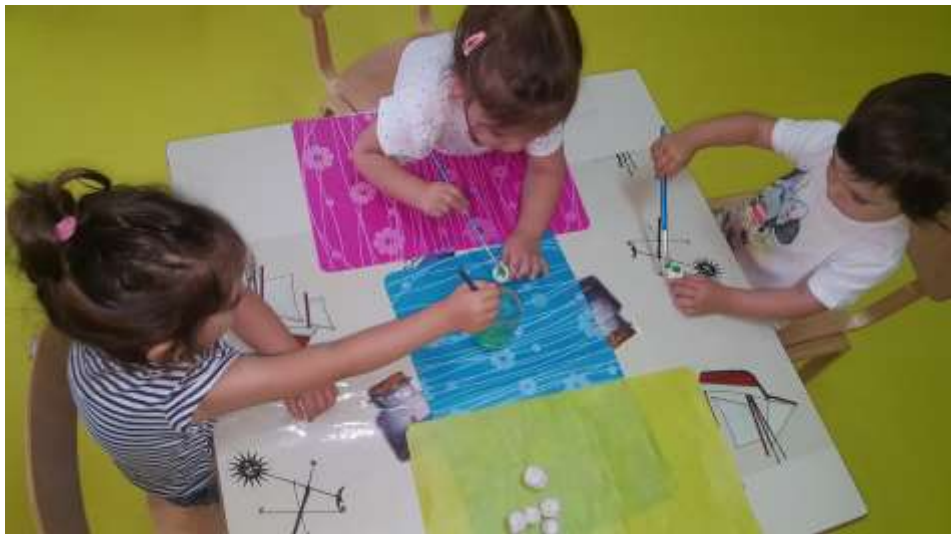
Sika 26. Pridružuju se još dvije djevojčice