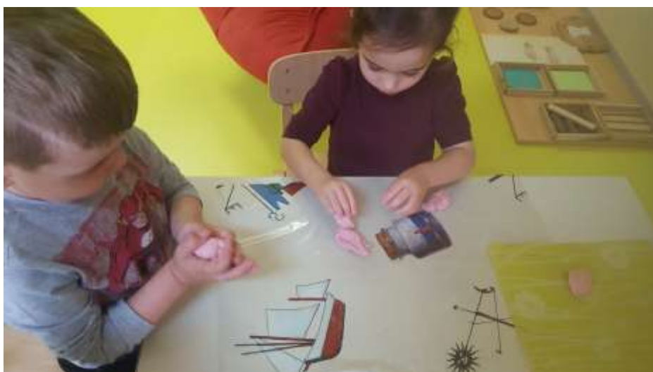
Slika 23. Dječak pokušava napraviti kuglicu uz pomoć ruku oponašajući odgojitelja

Izrađene kuglice smo osušili i iskoristili za stolno-manipulativne igre.