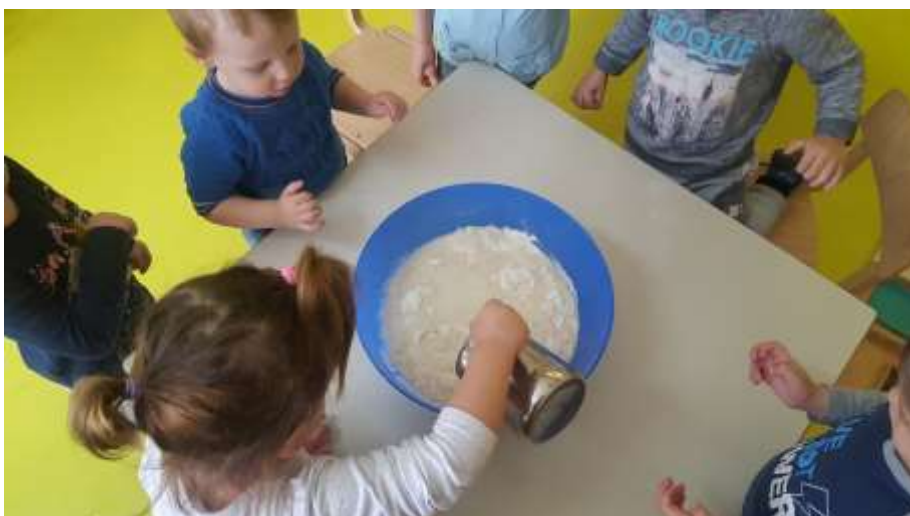
Slika 3. Djevojčica odlazi po vrč vode, te vodu pridružuje ostalim sastojcima