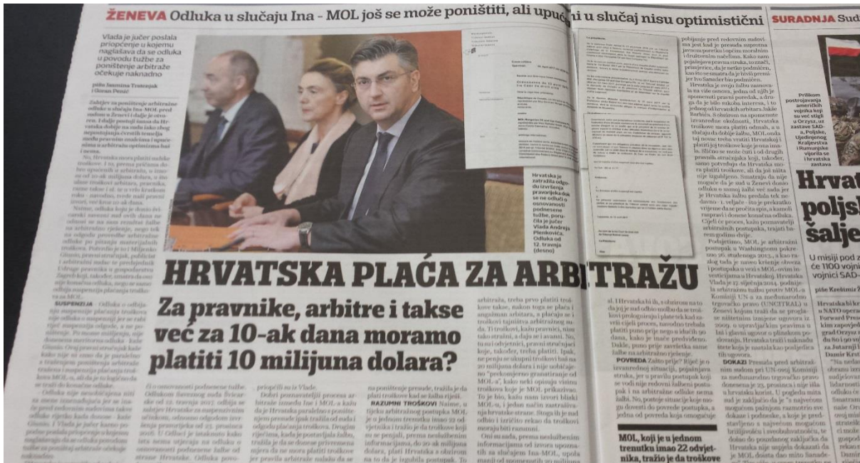
Ilustracija 3.4. Presnimka izvještaja iz Jutarnjeg lista