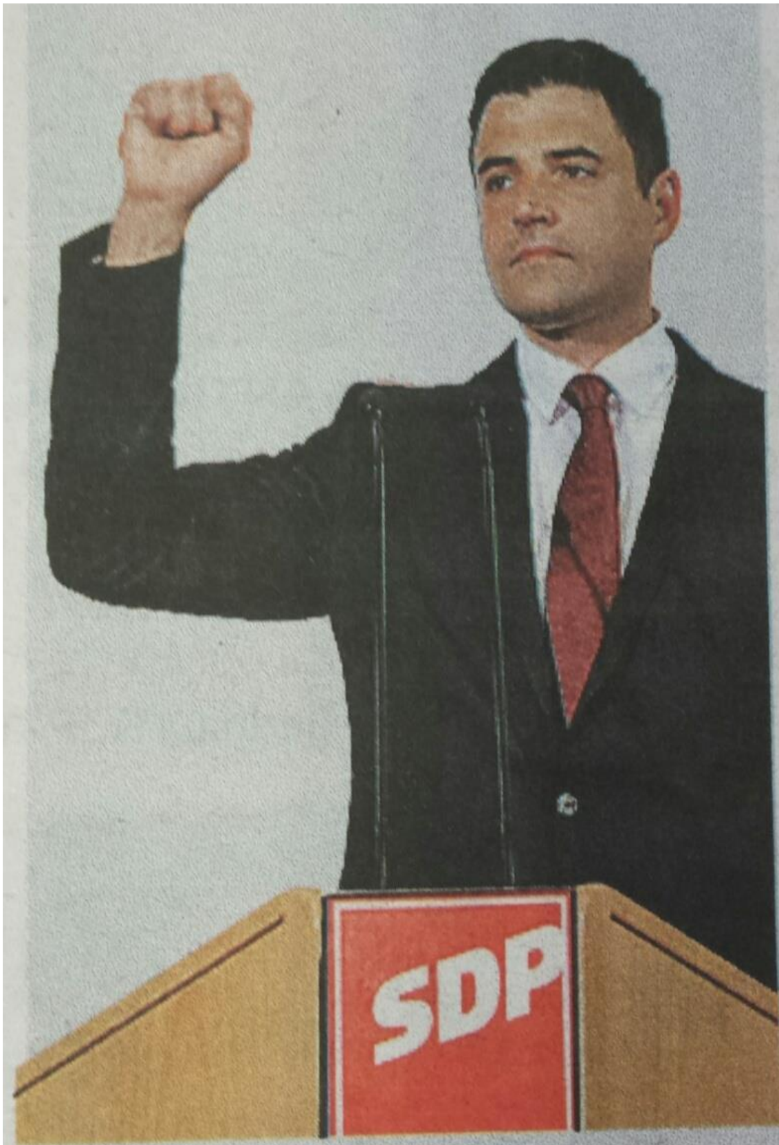
Presnimka 3.7. Bernardičeva fotografija iz Jutarnjeg lista koja se najčešće ponavlja