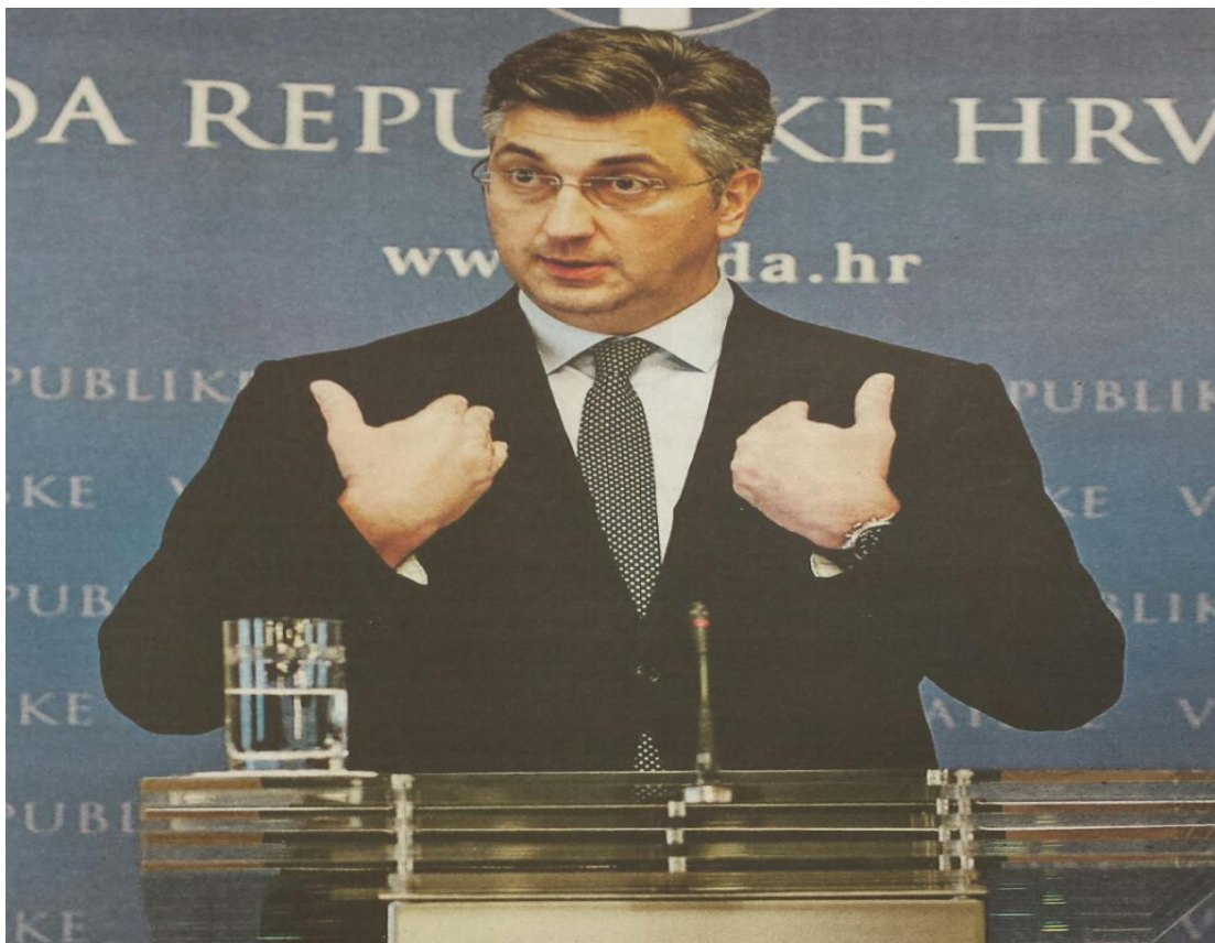
Ilustracija 3.6. Plenkovićeve geste u Jutarnjem listu