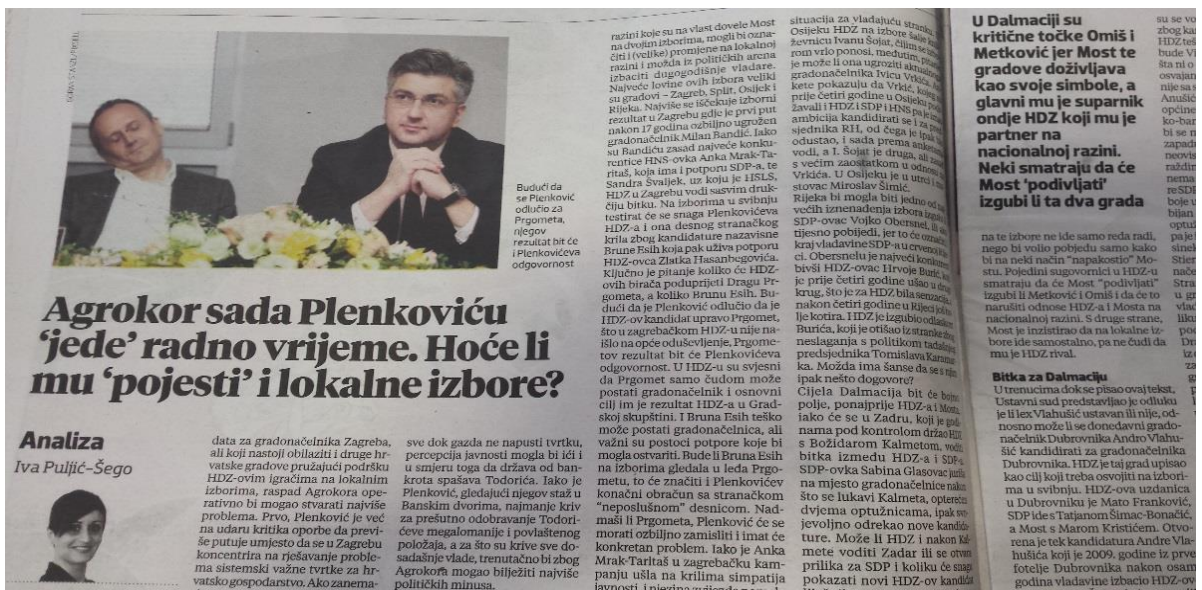
Ilustracija 3.4. Presnimka kolumne Ive Puljić-Šego u Večernjem listu