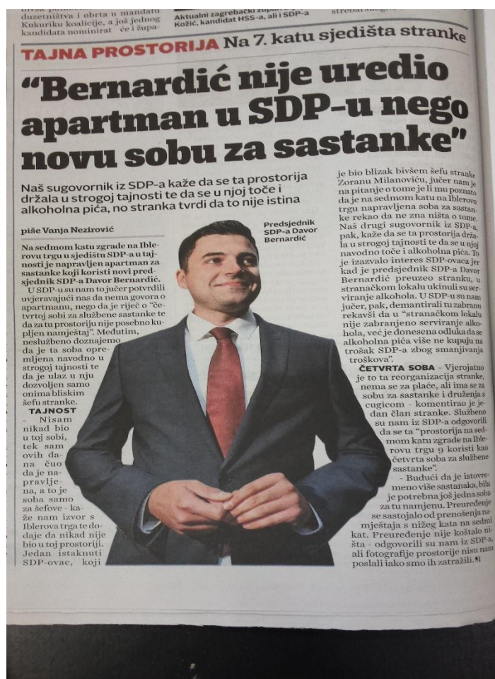
Ilustracija 3.5. Presnimka teksta u Jutarnjem listu

Na temelju svega navedenog može se zaključiti kako je Večernji list objavljivao više tekstova o Bernardiću nego Jutarnji list koji je često isticao njegovo prozivanje Vlade i upozoravanja na razne društvene probleme. U tekstovima se, ipak, najviše govorilo o lošem stanju u stranci i poziciji Davora Bernardića kao lidera stranke.