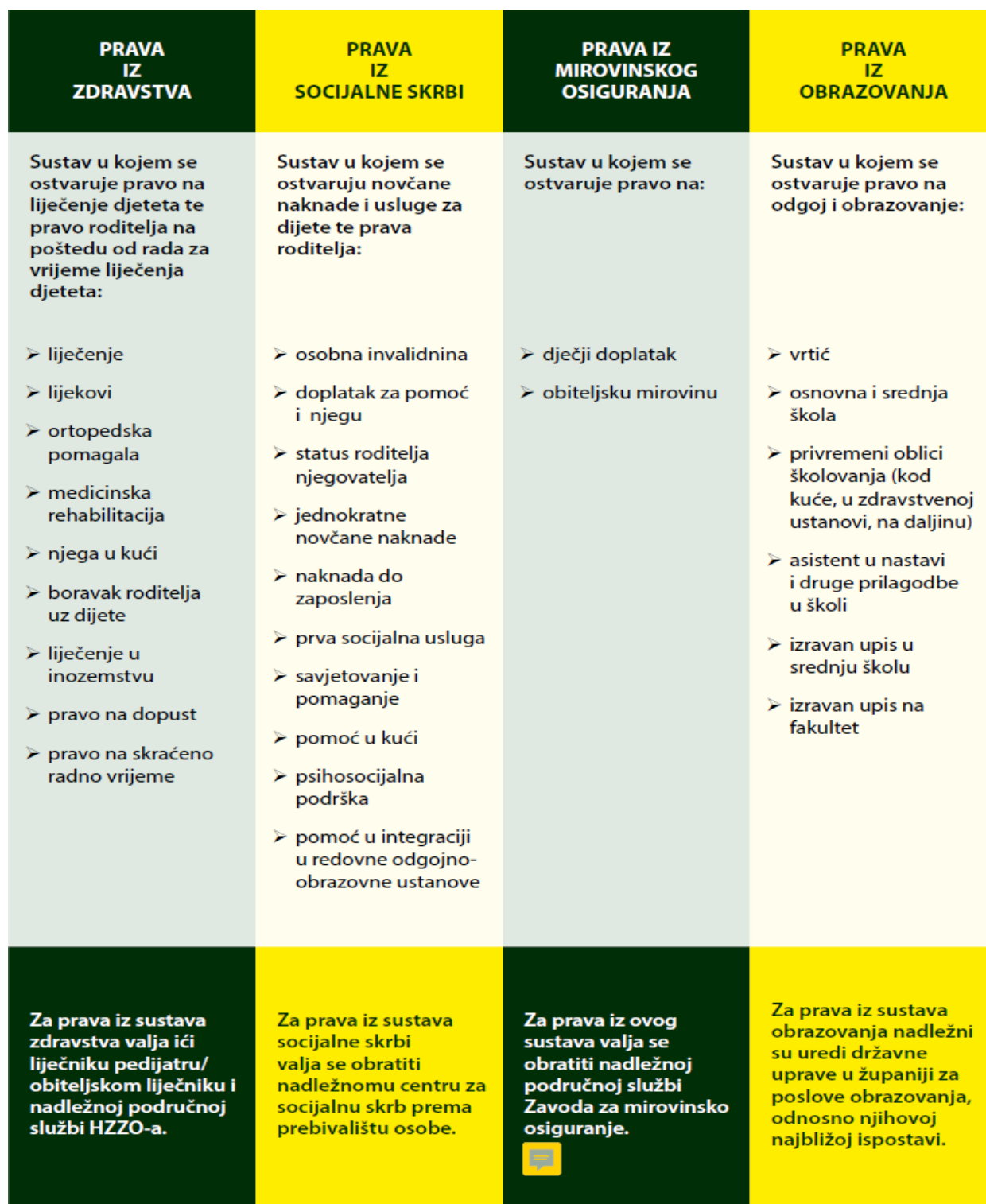
Tablica 5.1. Prava djeteta i roditelja suočenih sa malignom bolešću.