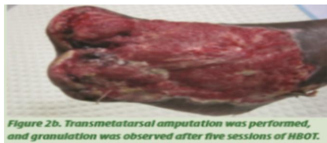
Slika 4.7.2. Nakon 5 terapija HBO

Izvor: L. Tongson, D. L. Habawel, R. Evangelista, J. Lerry Tan: Hyperbaric oxygen therapy as adjunctive treatment for diabetic foot ulcers, Wound International, December 1. 2013, Vol 4. Issue 4