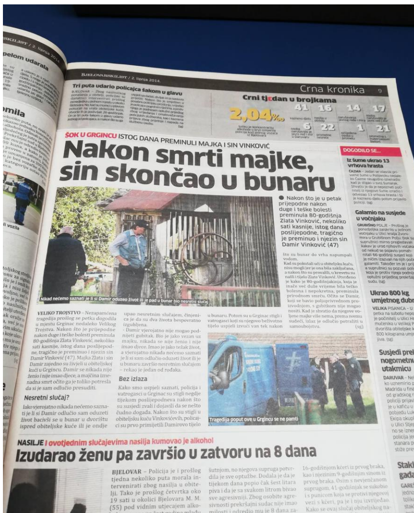
Slika 10: Bjelovarski list, objavljen dana 02. lipnja 2014. godine

2. lipnja naslovnica donosi naslov: „ Damir nije mogao živjeti bez majke, skočio u bunar “.