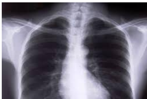
Slika br. 3.5. Prikaz RTG slike upale pluća

Upala pluća uzrokuje niz zaraznih uzročnika, uključujući viruse, bakterije i gljivice. Najčešći su Streptococcus pneumoniae što je najčešći uzrok bakterijske pneumonije u djece, Haemophilus influenzae tip b (Hib) kao drugi najčešći uzrok bakterijske pneumonije respiratorni sincicijski virus najčešći je virusni uzrok upale pluća, a u dojenčadi zaražene HIV-om (virusom humane imunodeficijencije), Pneumocystis jirovecii jedan je od najčešćih uzroka upale pluća, odgovoran za najmanje četvrtinu svih smrti od upale pluća kod novorođenčadi inficirane HIV-om. Pneumonija se može širiti na više načina. Virusi i bakterije koji se obično nalaze u djetetovom nosu ili grlu, mogu zaraziti pluća ako ih se udiše. Također se mogu širiti kapljičnim putem preko kašljanja ili kihanja. Uz to, upala pluća može se širiti krvlju, osobito tijekom i nedugo nakon rođenja djeteta kod poroda. Dok se većina zdrave djece može boriti protiv infekcije prirodnom obranom, djeca čiji je imunološki sustav ugrožen, izložena su većem riziku od razvoja upale pluća. Upala pluća liječi se antibioticima te osiguravanjem pogodnih okolišnih čimbenika, poput prozračivanje zraka onečišćenih zatvorenih prostorija. Poticanje dobre higijene u kućama sa više ukućana ili u vrtićima, također smanjuje broj djece oboljele od upale pluća [14].