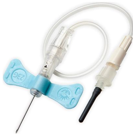
Slika 6.2.2. Bebi leptirić set sa zaštitnim mehanizmom