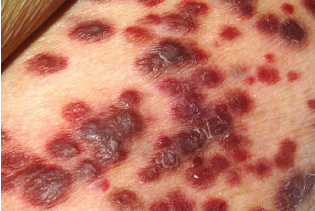
Slika 4.3.1. Kaposijev sindrom u osobe oboljele od HIV infekcije.