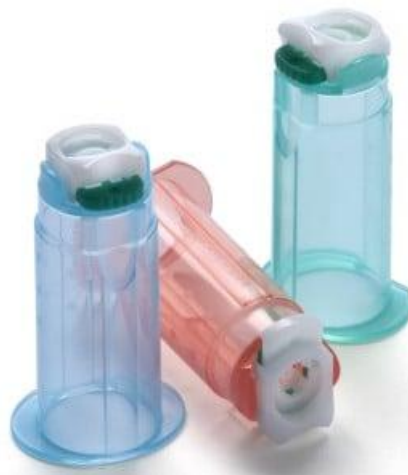
Slika 6.2.3. Sigurnosni držači igala s mehanizmom odbacivanja igle