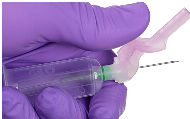
Slika 6.2.1. Sigurnosna hipodermalna igla

Tako se u novije vrijeme u postupku venepunkcije koriste sigurnosne hipodermalne igle (prikazano na slici 6.2.1.) koje pružaju jednostavan i učinkovit način prikupljanja krvi te pomažu smanjiti mogućnost uboda. Nadalje, bebi leptirić set sa zaštitnim mehanizmom koji nudi mogućnost sigurnosne uporabe igle koja se uvlači automatskim mehanizmom pritiskom na gumbić (prikazano na slici 6.2.2.) te sigurnosni držači igala s mehanizmom odbacivanja igle (prikazano na slici 6.2.3.) [15].