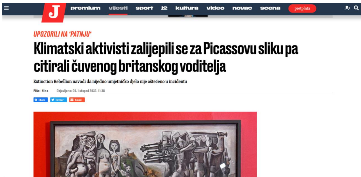
Slika 6: Primjer neutralne obojenosti naslova u Jutarnjem listu

Obojenost naslova kod tekstova vezanih za klimatski aktivizam mladih imala je najviše neutralnost čak 30 njih, 18 je imalo negativnu a šest pozitivnu obojenost. Kod tekstova vezanih za klimatski aktivizam mladih usmjerenog na uništavanje svjetske umjetničke baštine prisutno je pet negativnih obojenosti naslova i četiri neutralnih obojenosti naslova. S toga prikazujem primjer neutralne obojenosti naslov.