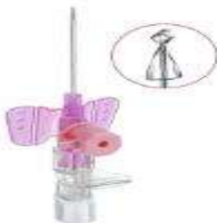
Slika 4.1.3. ( B.Braun Melsungen AG)

Tehničko rješenje nudi bolju zaštitu od uboda iglom i zaštitu od curenja sadržaja iz šuplje igle. Isto tako upotrebljava se samo za aplikaciju terapije, te zbog same izvedbe u proizvodnji cjenovno poskupljuje proizvod.