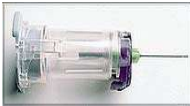
Slika 4.1.4. (Punctur-Guard sistem)

Ova tehnička izvedba na tragu je poboljšanja već postojećeg proizvoda, te je jedno od boljih rješenja za uspostavu perifernog venskog puta. Manipulativno prilikom rada sa takvim iglama nema novih zahtjeva za promjenu same procedure izvođenja medicinsko tehničkog zahvata. Međutim i dalje postoji potreba za neprobojnim kontejnerom, koji se mora nalaziti kod pacijenta u koji se odlažu oštri predmeti – igle. Dostupno odnedavno i u OB Varaždin (sprečava se ubodni incident, ali ne i kapanje zaostale krvi iz šuplje igle).