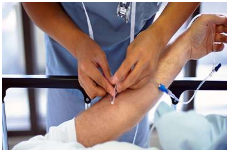
Slika 3.3.1 Prikaz neispravnog pristupa provođenju medicinsko tehničkog zahvata – venepunkcije na pacijentu

Post ekspozicijske mjere se moraju primijeniti unutar 72 sata od trenutka ozljede. Određivanje markera za djelatnika i bolesnika odmah nakon incidenta >48 sati Poznato je da primjena antiretrovirusnih lijekova rano nakon izloženosti HIV-u (u roku od 48-72 sata) smanjuje rizik razvoja infekcije za više od 80%. Ako je potrebno, treba uvesti terapijsku profilaksu djelatnika. Daljnje kontrole provode se kako bi se pravodobno mogla otkriti bolest i što ranije početi s liječenjem. I u slučajevima kada nije prenesena bolest, emocionalni stres ozlijeđenog zdravstvenog ili nezdravstvenog djelatnika i njegove obitelji može biti ozbiljan problem koji zahtjeva savjetovanje. Poslodavac istražuje uzroke i okolnosti te bilježi nesreću/incident i prema potrebi poduzima potrebne mjere. Radnik je dužan u primjerenom roku pružiti relevantne informacije koje su potrebne da se upotpune informacije o nesreći odnosno incidentu. Poslodavac u slučaju ozljede razmatra sljedeće mjere,uključujući,prema potrebi,savjetovanje radnika i zajamčeno liječenje. Rehabilitacija,nastavak radnog odnosa i pristup odšteti podliježu nacionalnom zakonodavstvu. Podaci o ozljedi,dijagnozi i liječenju su povjerljivi i poštivanje njihove tajnosti je od najveće važnosti.[13]