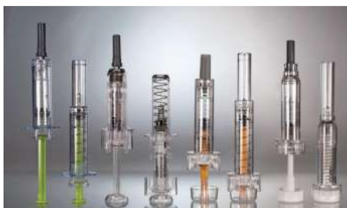
Slika 4.1.2. Prikaz igle s automatskim retraktorom (Bausch+Stroebel)

Tehničko rješenje je dobro za aplikaciju terapije zbog prevencije uboda iglom, no ne sprečava se curenje iz šuplje igle. Isto tako ne aktivira se zaštitni mehanizam na pasivan način, već je potrebno aktivno uključiti zaštitni mehanizam.