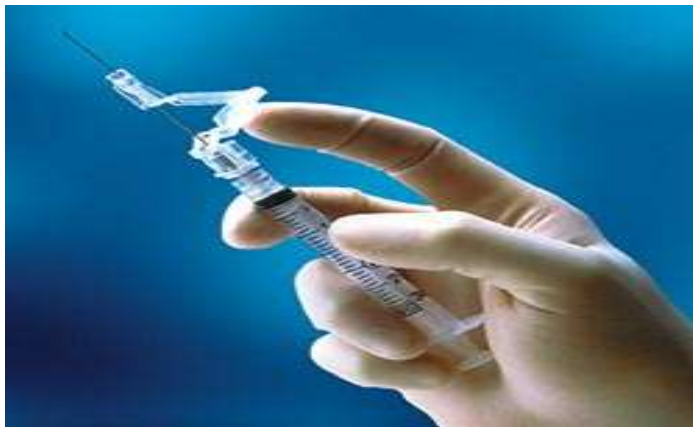
Slika 4.1.1. Prikaz tehničkog rješenja u sigurnoj aplikaciji terapije (SafetyGlide Safety Needle)

Na tržištu postoje tehnička pomagala koja svojom funkcionalnošću doprinose smanjenju neželjenih ubodnih incidenata (prilikom aplikacije terapije ili venepukciji).