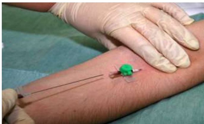
Slika 4.3.1. Uspostava perifernog venskog puta

Poboljšanja postoje, a neka su već i u upotrebi, te bi ih valjalo koristiti u svakodnevnoj praksi. Iz prethodno navedenog istraživanja potkrepljenog podacima vidljiva je potreba pozitivnih promjena, kako u povećanju broja prijava ubodnih incidenata tako i u potrebi razvijanja novih tehničkih rješenja.