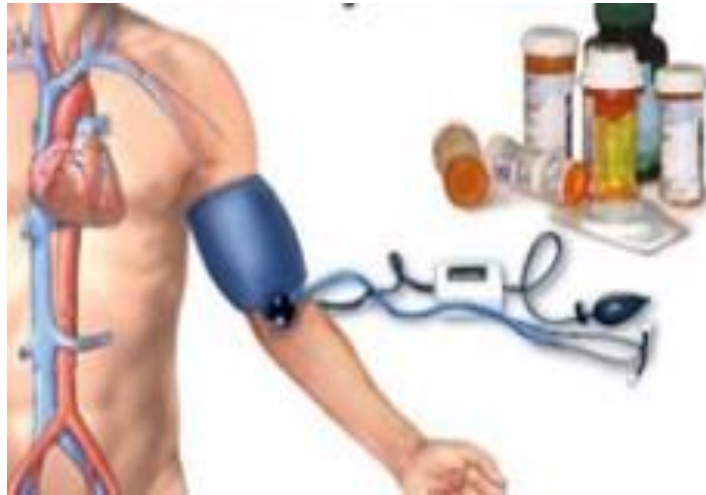
Slika 4.3.5.1. Prikaz mjerenja arterijskog krvnog tlaka

https://www.google.hr/search?q=mjerenje+tlaka&client=firefox-b-ab&source=lnms&tbn=isch&sa=X&ved=0ahUKEwjo9cTJ857PAhVGWRQKHXQ8CS0Q_AUICCgB&biw=1366&bih=608#imgrc=2XUWaRkvzkwYOM%3A