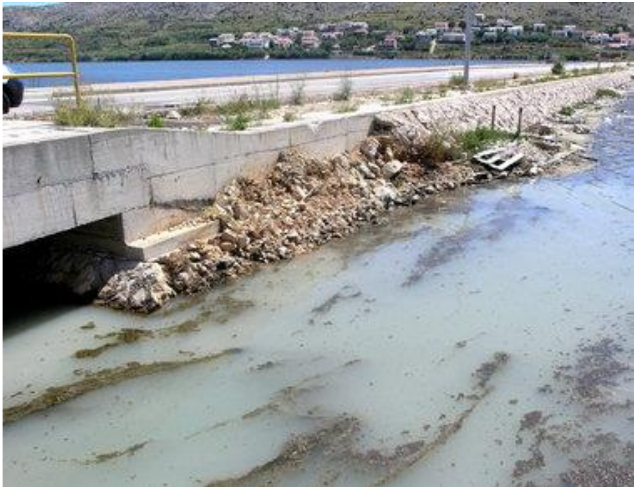
Slika 1: Onečišćenje vode