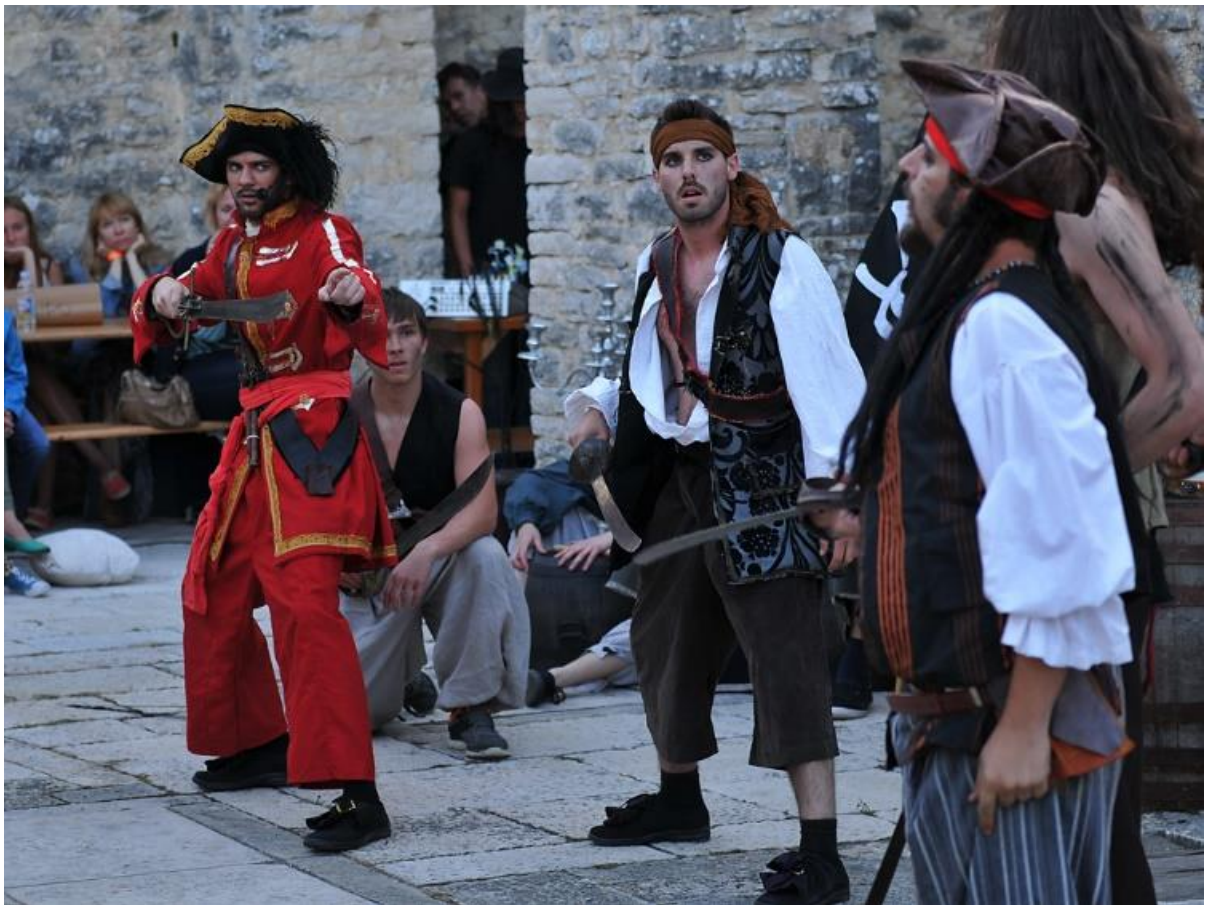
Slika 3: Morganovo blago - Dvigrad

Izvor: http://istrainspirit.hr/blog/nova-sezona-istra-inspirita-zapocela-u-dvigradu/ , 30.6.2015.