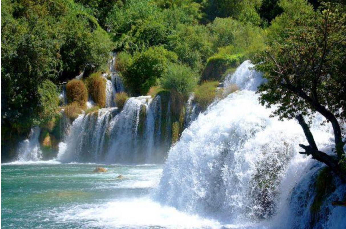
Slika 2: Nacionalni park Krka

prirodne rijetkosti, a jedan od načina je i klasificiranje u više tipova zaštićenih prostora kao što su strogi prirodni rezervati, nacionalni parkovi i parkovi prirode.