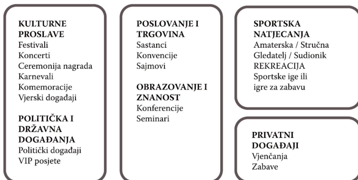
Shema 1: Organizirani događaji po formi

Događaje također možemo klasificirati i prema formi što prikazuje sljedeća shema 1.