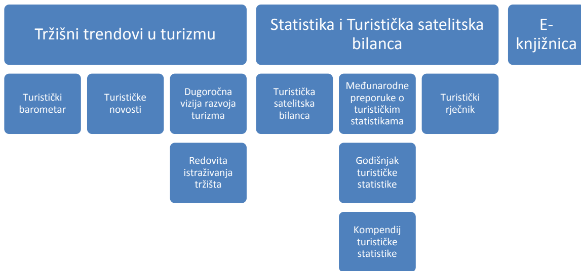
Slika br.3: Publicistička djelatnost UNWTO – a

U sljedećem poglavlju slijedi kratki pregled Svjetskog vijeća za putovanje i turizam te njegovo polje djelovanja.