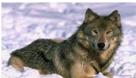
Vuk na području NP „Plitvička jezera“

Slika 1. Natura 2000, zaštićena područja i zaštićene vrste u Republici Hrvatskoj