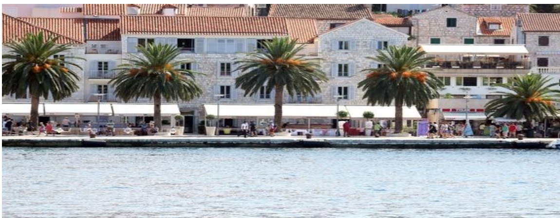
Slika 3.: Održivi turizam