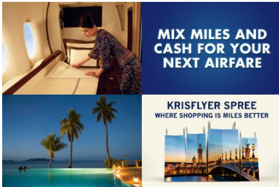
Slika 4: Pay With KrisFlyer Miles