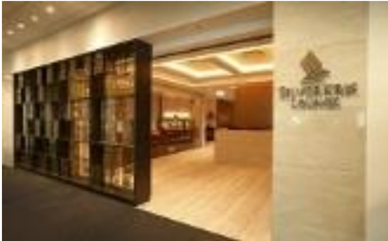
Slika 3: KrisFlyer Lounge Entrance