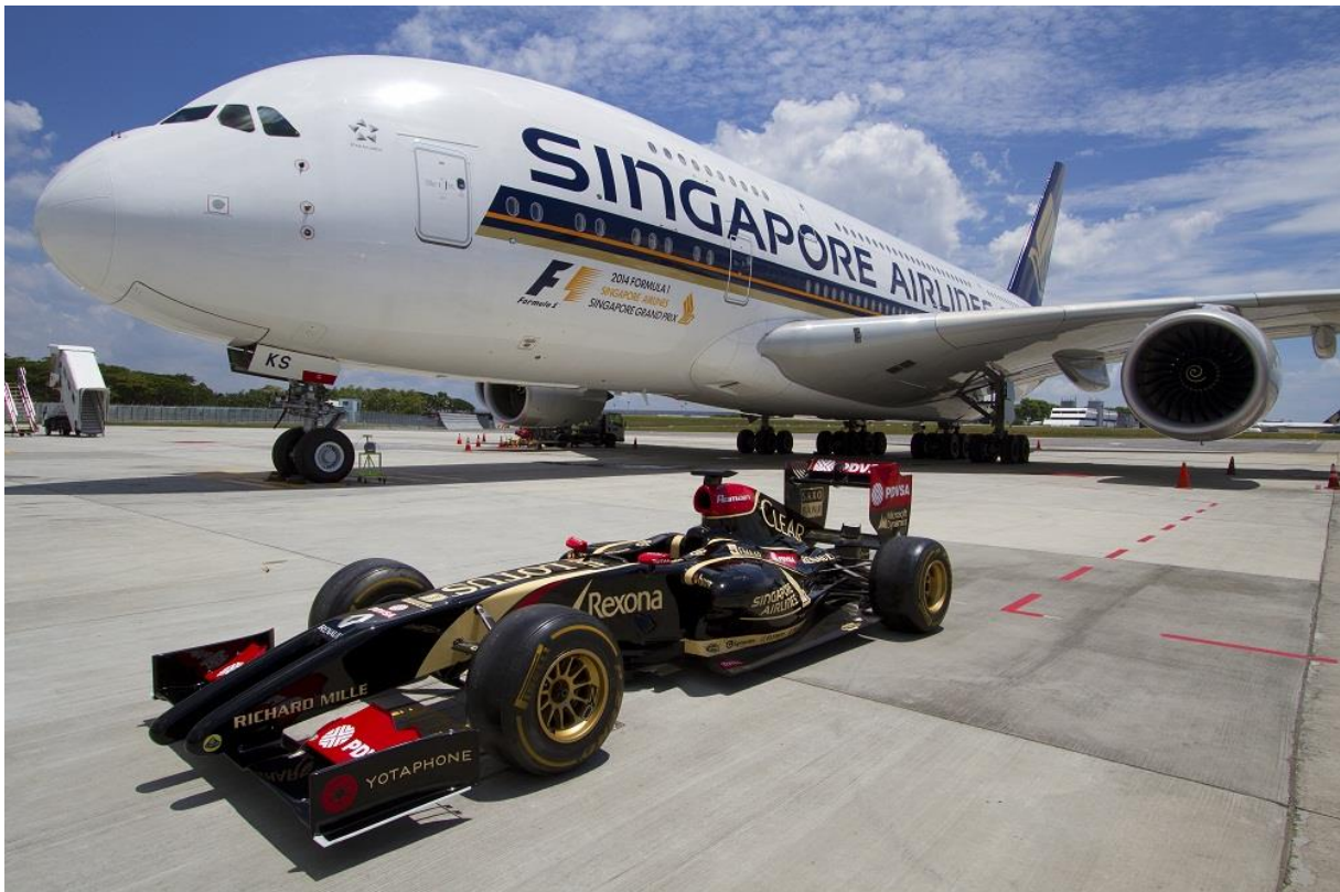
Slika 5: Singapore Airlines To Be Title Sponsor Of Formula 1 Singapore Airlines Grand Prix

Izvor: < www.singaporeair.com/en_UK/press_release_news/ne140415 , ( 14. 4. 2015.)