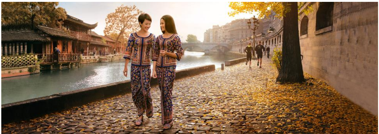
Slika 1: Singapore Girl, through the years