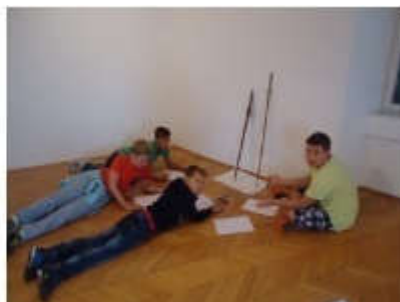
Slika 20. Dječji posjet muzeju (pedagoška dokumentacija Dječjeg vrtića "Pjerina Verbanac", Labin.)