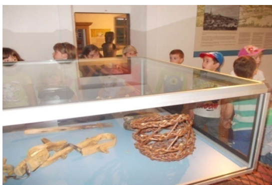
Slika 22. (pedagoška dokumentacija Dječjeg vrtića " Pjerina Verbanac", Labin.)