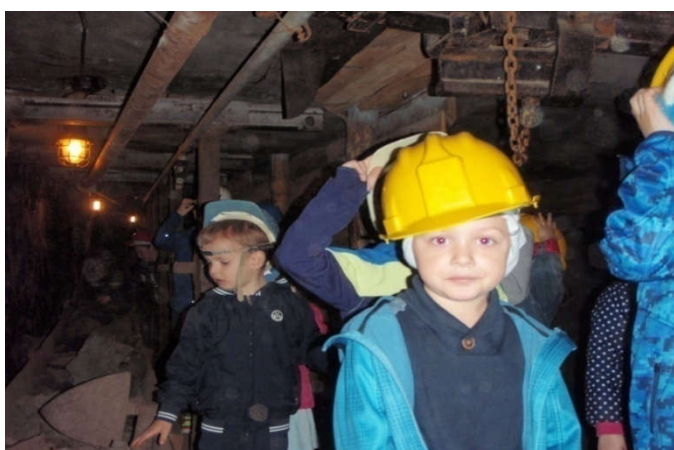
Slika 23. (pedagoška dokumentacija Dječjeg vrtića " Pjerina Verbanac", Labin.)