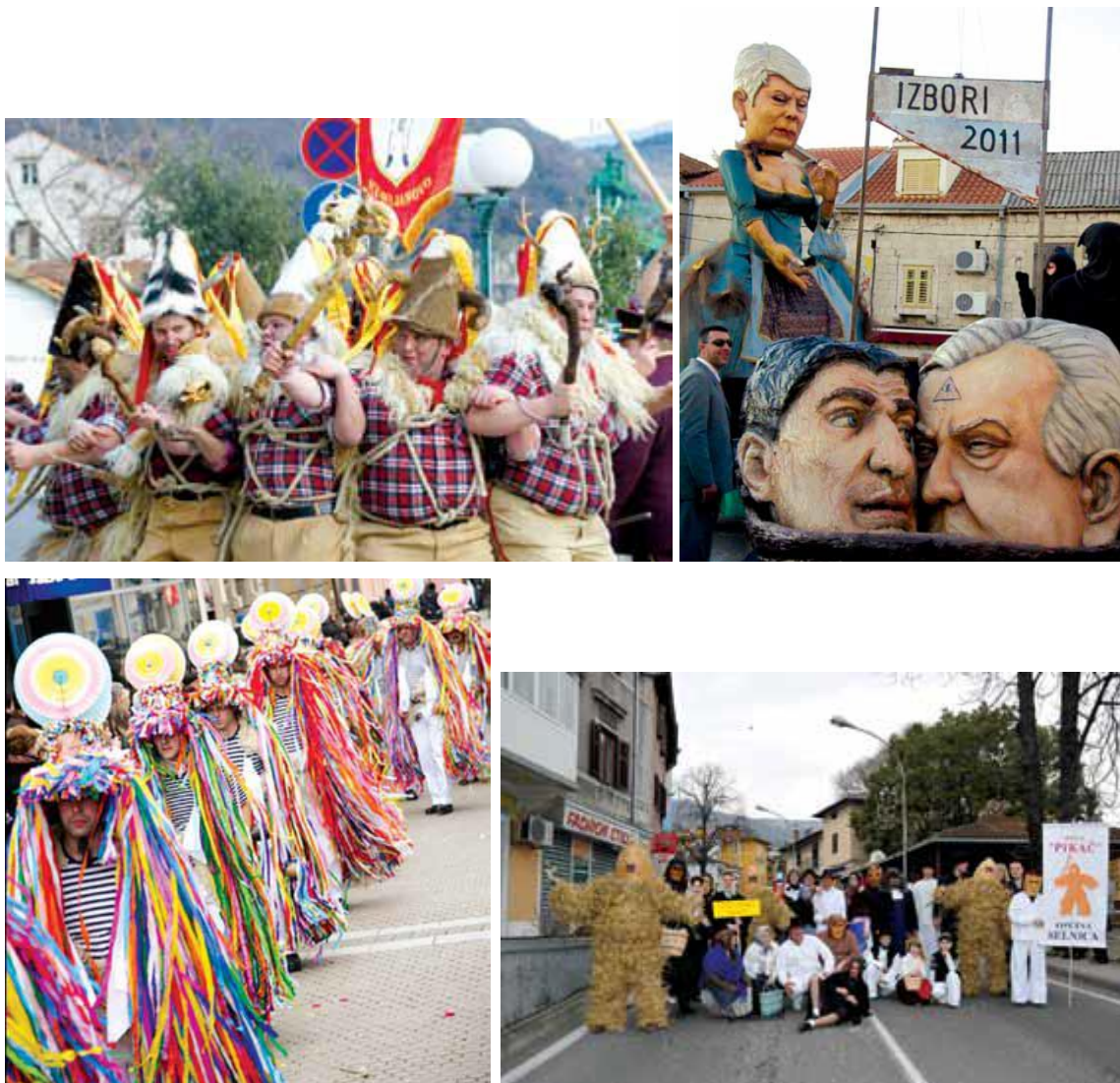
Slika 6.: Nekoliko karnevalskih likova iz različitih hrvatskih gradova