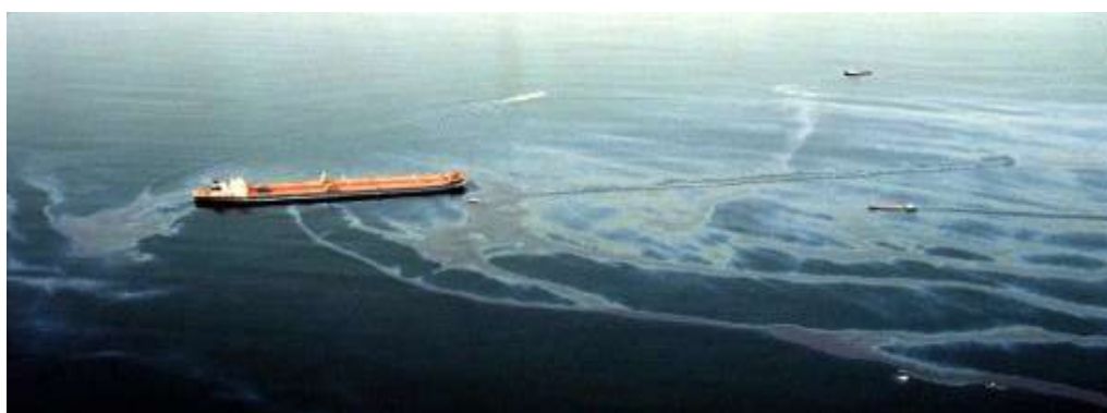
Slika 8. Havarija tankera Exxon Valdez