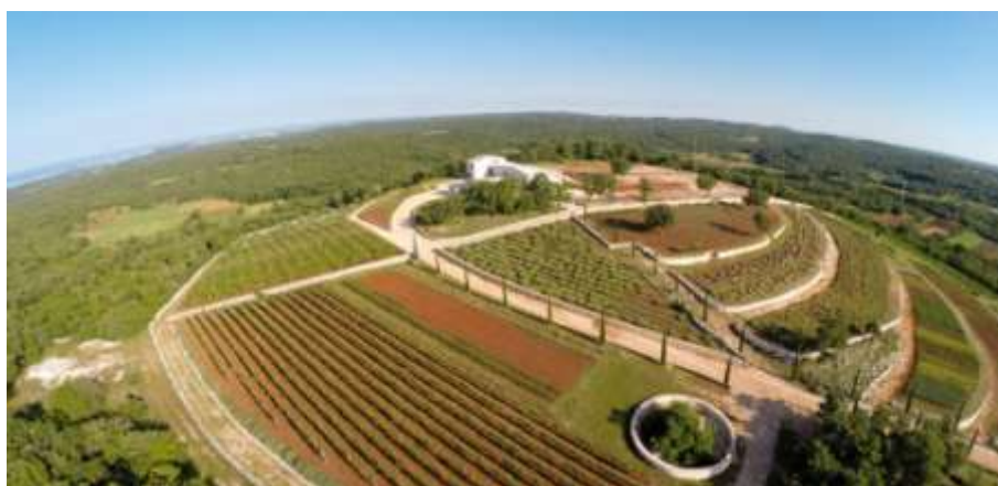
Slika 13. Park „Histria Aromatica“