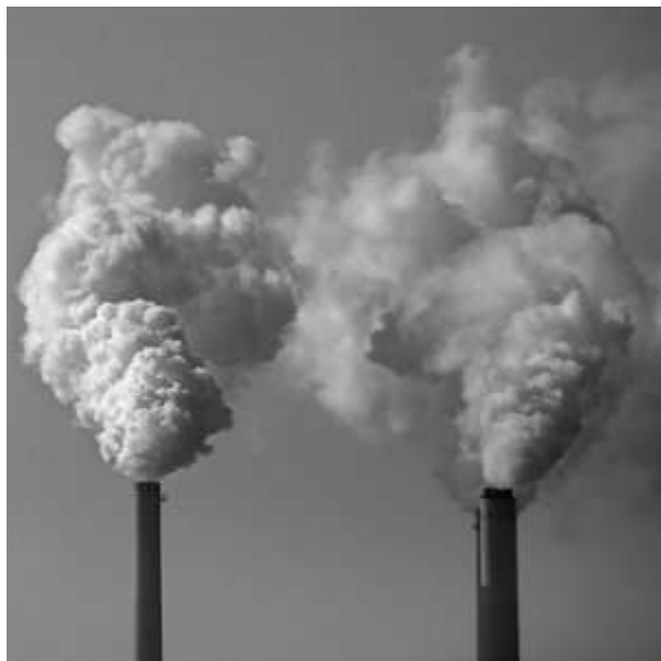
Slika 7. Onečišćenje zraka