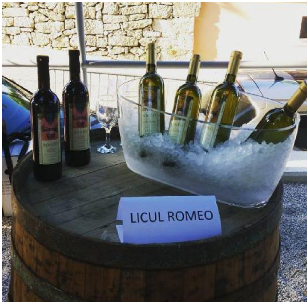
Slika 6: Vina u podrumu Licul