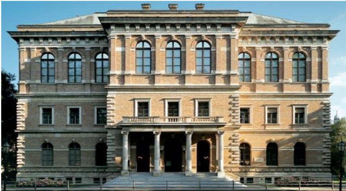
Slika 4. Palača Hazu

Palača Hazu ili palača akademije je najveća znanstvena i umjetnička ustanova te se nalazi u neorenesansnoj palači koja se sagradila samo za tu namjenu 1880. godine. Jedina je to prava palača u Zagrebu. (Vitković, 2011: 2) Najposebnija je po tome što se u njenom atriju čuva Bašćanska ploča koja je jedan od najstarijih zapisa na hrvatskom jeziku pisan glagoljicom. U njoj je nalaze još neka mnoga poznata umjetnička dijela čime čuva dugu hrvatsku povijest i tradiciju.