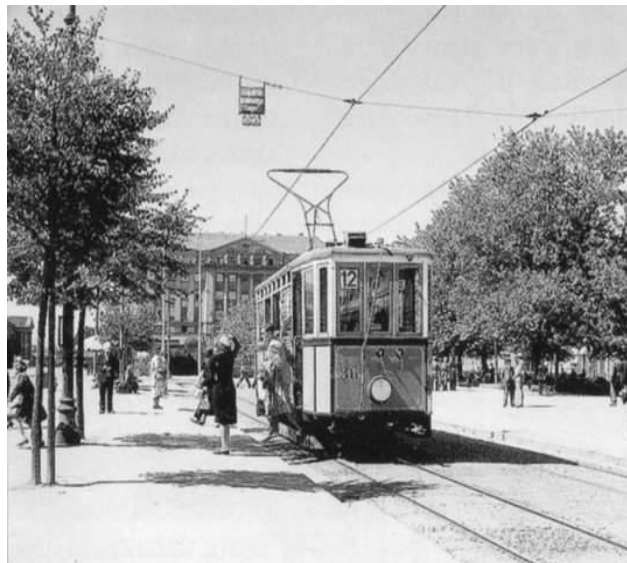
Slika 5. Prvi električni tramvaj

„Zagreb nema prijestolnički duh Beča, ni prenaplašenu raskoš Pešte, niti neusporedivu draž Praga, ali je svojim sukladnim smještajem, slikovitošću svojih ambijenata, živošću i ljepotom svojih ulica, trgova, parkova i spomenika istinski oblikovan po mjeri čovjeka.“ (Travirka, 2009:5)