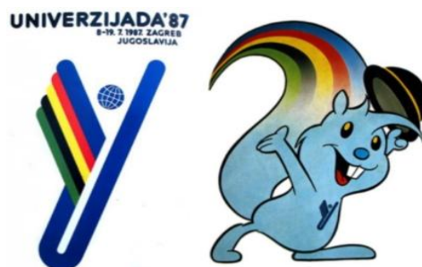
Slika 8. Logotip i maskota Univerzijade Zagi

Univerzijada je imala veliki značaj radi bogatog sportskog programa, ali bitne stavke bile su organizacija i pripreme. Gradili su se mnogi objekti: Rekreativno sportski centar Jarun, Plivački i vaterpolo centar ASD mladost, Rekreativno sportski centar Šalata, stadion Dinamo i Dom sportova. Radi bolje infrastrukture izgradio se autobusni kolodvor, dok je željeznički kolodvor bio obnovljen. Unatoč krizi i inflaciji, Zagreb i njegova okolica doživjeli su „infrastrukturnu renesansu“. Realizirali su se poslovi na raznim područjima djelatnosti: sport, organizacija izgradnje, financije, marketing, organizacije boravka, informiranja i propagande, tiska i izdavaštva, kulture i zabave, općih poslova, elektroničke tehnologije itd. (Zekić, 2007: 3) Veliki značaj dobio je i kulturni program kao promidžba organizatora. Značajan dio vezan za kulturu bilo je otvaranje velikog broja muzeja i galerija s mnogo različitih izložbi u tijeku trajanja Univerzijade. Teme nisu isključivo bile sportske već se prezentirala nacionalna baština i tradicija što je privuklo velik broj domaćih i stranih posjetitelja.