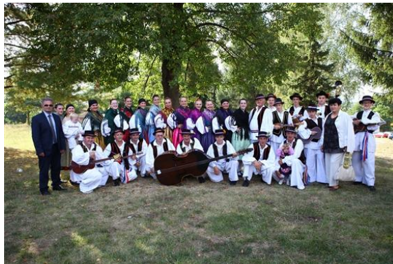
Slika 1. HKUD „Slavonija“ Jakšić.