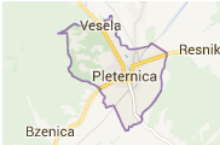
Slika 8: Grad Pleternica