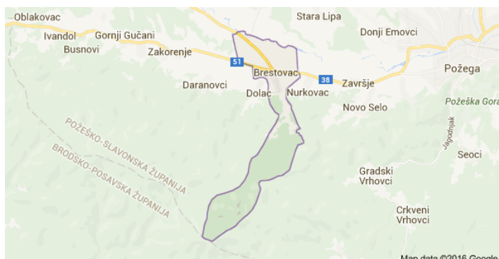
Slika 16: Općina Brestovac