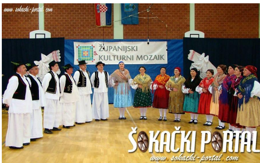
Slika 19: KUD „Požeška dolina“.