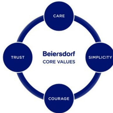
Slika1: Četiri temeljne vrijednosti poduzeća „Beiersdorf“