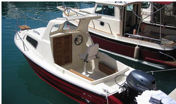
Slika 3: Model Gurges 545