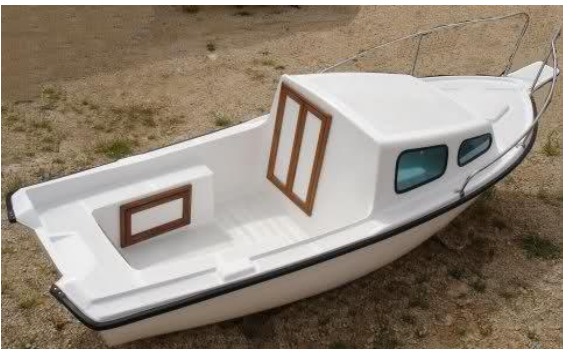
Slika 2: „Istranka“