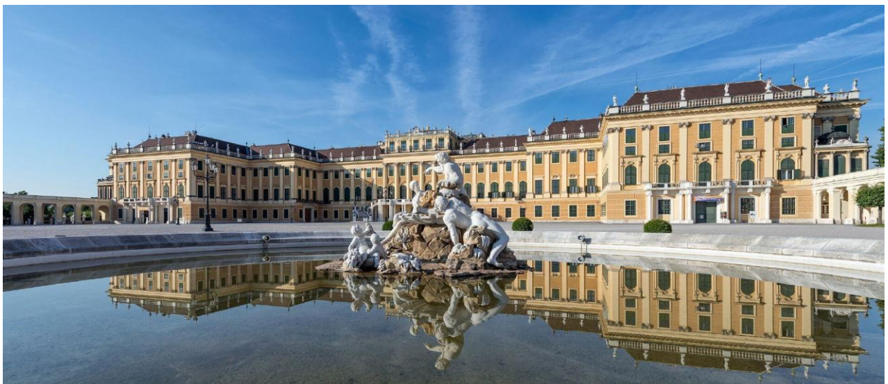
Slika 22. Dvorac Schönbrunn

Izvor: Gračanin, Hrvoje, Slavne povijesne ličnosti , Zagreb: Meridijani, 2015., str. 195.