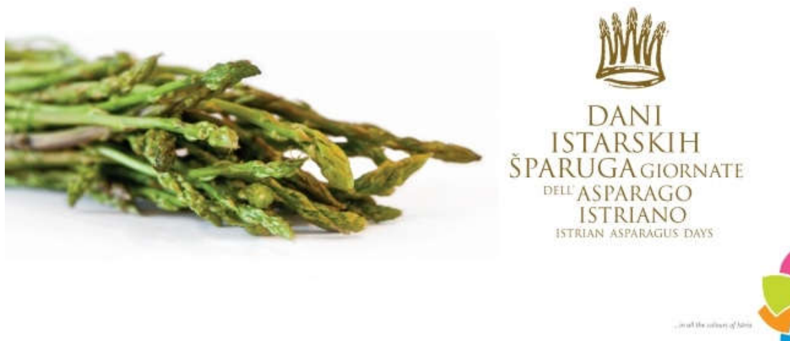
Slika 3. Dani istarskih šparoga