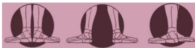
Slika 1. Prve tri pozicije u baletu

U izvođenju baletnih pozicija obično dodajemo i plié - polako savijamo koljena i ravnih se leđa spuštamo u polučučanj.