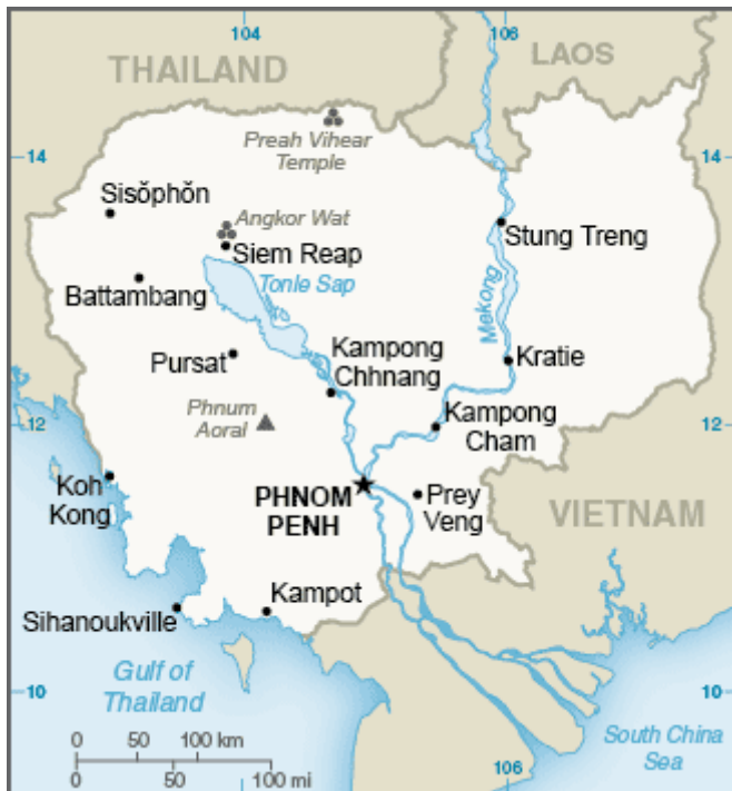
Slika 4. Zemljopisna karta Kambodže