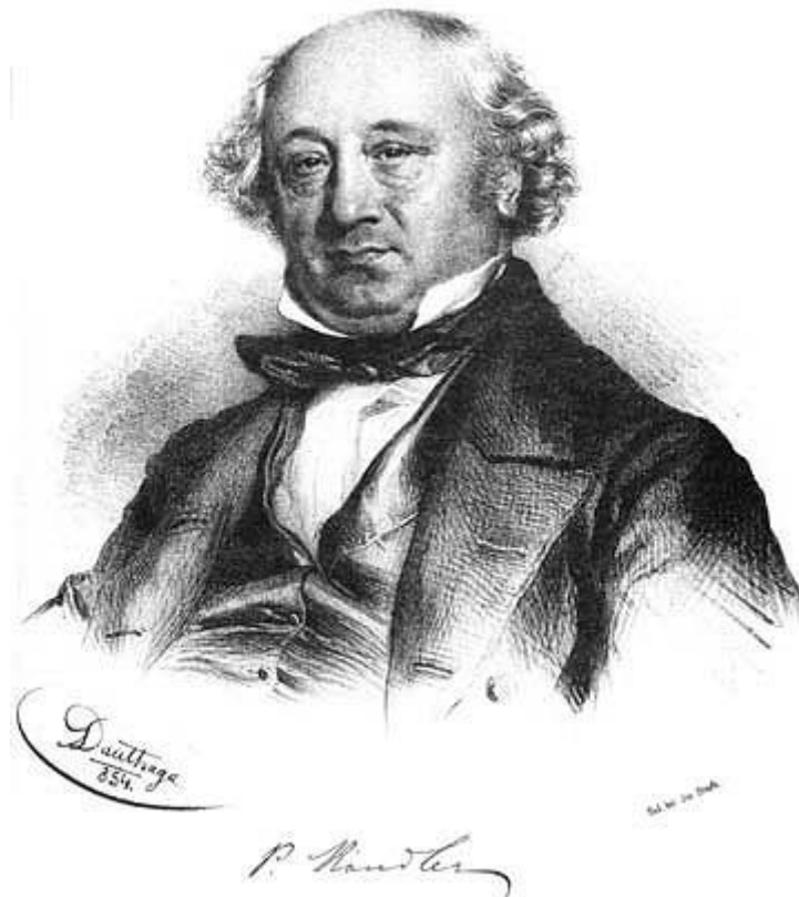
Slika 9. Pietro Kandler