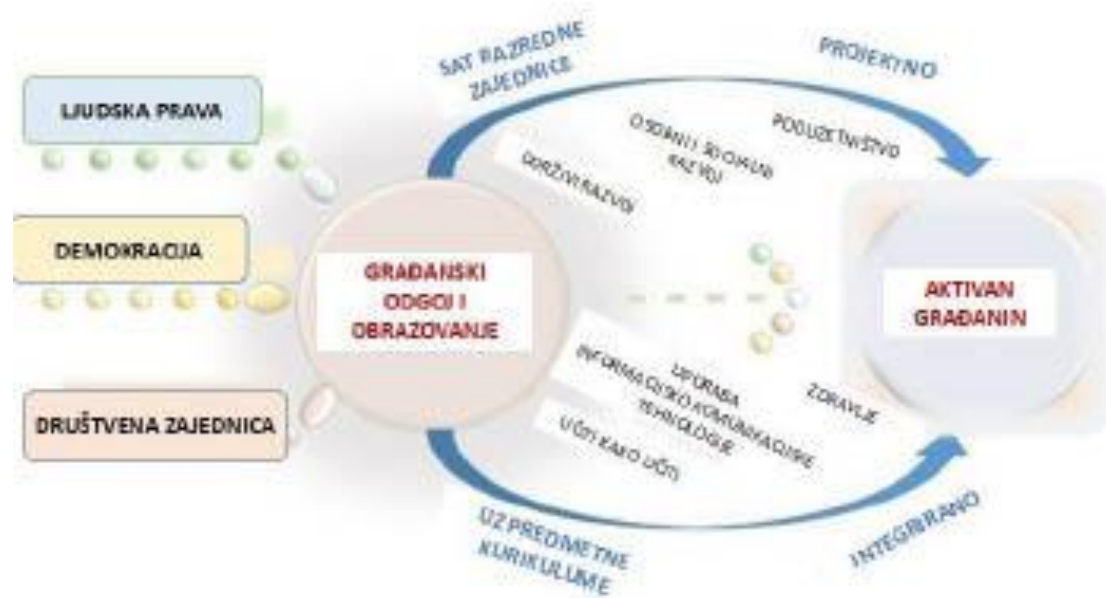
Slika 1. Shematski prikaz međupredmetne teme Građanski odgoj i obrazovanje 9

svoje konceptualno i teorijsko utemeljenje u sustavu odgoja i obrazovanja. Zbog velikih promjena koje se događaju u području odgojno-obrazovne politike Republike Hrvatske gotovo je nemoguće predvidjeti ishod ovog dugogodišnjeg procesa (Pažur, 2017). Na temelju članka 27. stavka 9. Zakona o odgoju i obrazovanju u osnovnoj i srednjoj školi (NN, 87/08, 86/09, 92/10, 105/10 – ispravak, 90/11, 16/12, 86/12, 94/13, 152/14, 7/17 i 68/18) ministrica znanosti i obrazovanja Blaženka Divjak donosi odluku o donošenju kurikuluma za međupredmetnu temu Građanski odgoj i obrazovanje za osnovne i srednje škole u Republici Hrvatskoj koja je na snagu stupila 25. siječnja 2019. godine.