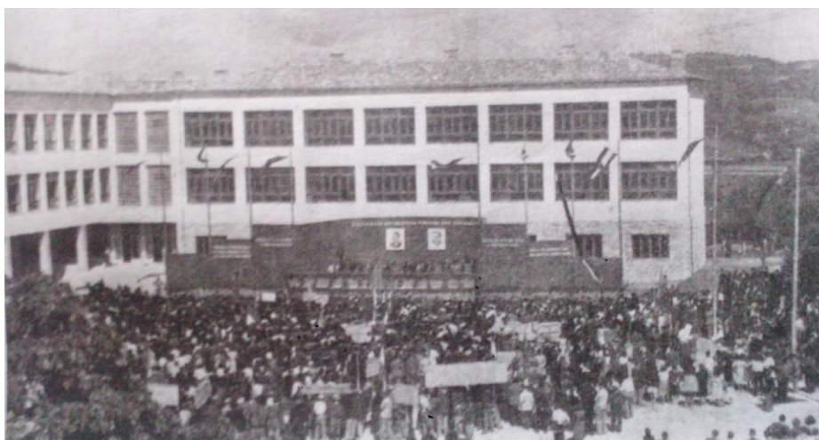
Slika 2. Svečano otvaranje zgrade nove gimnazije u Pazinu

Nova zgrada osnovne škole i gimnazije u Pazinu počela se graditi u prosincu 1947. godine. Njezino svečano otvaranje održano je povodom rujanskih svečanosti, 10. i 11. rujna 1949. godine. 94 Bio je ovo zasigurno jedan od najznačajnijih i definitivno u tisku najviše najavljavani događaj u prvih deset godina poratnog Pazina. Velika proslava obuhvaćala je, osim otvaranja škole, i obilježavanje šeste godišnjice općeg narodnog ustanka protiv fašizma u Istri, potom pedesetu godišnjicu osnivanja Prve hrvatske gimnazije u Pazinu, a ovom prigodom otkrivena je brončana bista tada nedavno preminulog Vladimira Nazora, koji je također vezan za Pazin, te je otkrivena i spomen-ploča Otokaru Keršovaniju, po kojem je ova škola i dobila ime. Pred oko 30 tisuća okupljenih, kako prenosi Glas Istre , govore su održali visoki uzvanici: dr. Vladimir Bakarić, predsjednik vlade NR Hrvatske, ministar prosvjete dr.