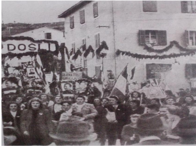
Slika 1. Dolazak Međusavezničke komisije u Pazin

Bilo bi zanimljivo istražiti koliko su i na koji način strani mediji tada pokazivali interes i izvještavali o boravku komisije u Julijskoj krajini. Poznato je međutim, da je dopisnik novina „ New York Herald Tribune “ pisao o tome u svojem listu, navodeći kako članovi komisije na svom putu „ nailaze na jednodušnu