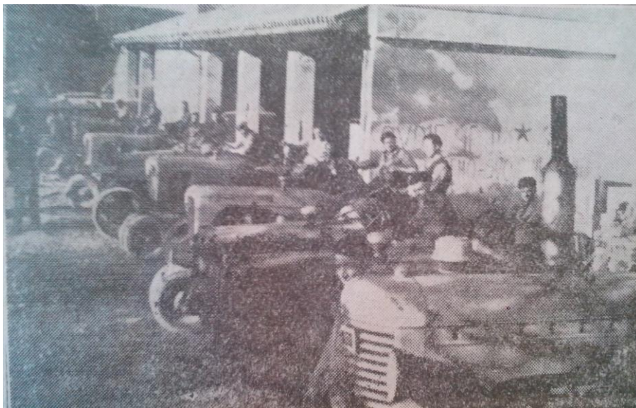
Slika 5. Traktorska brigada SPOM-a u Pazinu spremna za polazak na oranje

knjigovodstvene poslove unutar zadruga. Po zanimanju zadrugari kotara Pazin su radnici, prodavači, trgovci, domaćice, i naravno poljoprivrednici. Unutar zadruga obnašaju pak sljedeće dužnosti: predsjednik zadruga, knjigovođa, pomoćni knjigovođa, prodavač, nabavljač, evidentičar, gostioničar (ukoliko zadruga posjeduje gostionicu). Predsjednik zadruga često nije najškolovaniji među zadrugarima, ali ni najbolje plaćen, već je to najčešće knjigovođa. Primjećujemo i imena koje nose zadruga, ne samo na Pazinštini, već i diljem Jugoslavije. Ona su redom vezana uz NOB, narodne heroje i istaknute političare. Zanimljivo