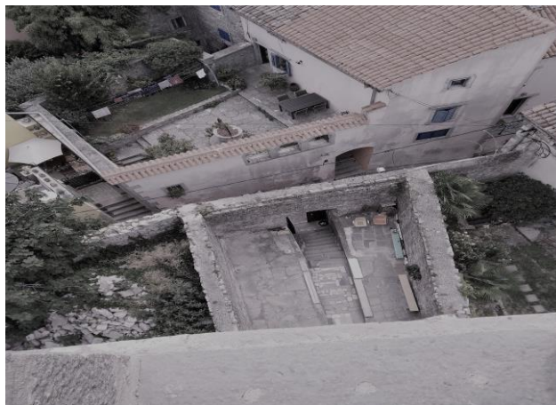
Ostaci crkve svetog Justa (pogled sa zvonika)

Izvor: Vlastiti izvor (06. rujan, 2019.)