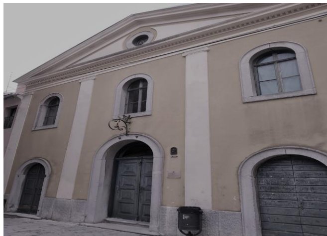
Izvor: vlastiti izvor (06. rujan, 2019.)