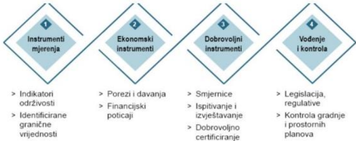
Slika 2. Instrumenti za implementaciju održivog razvoja turizma