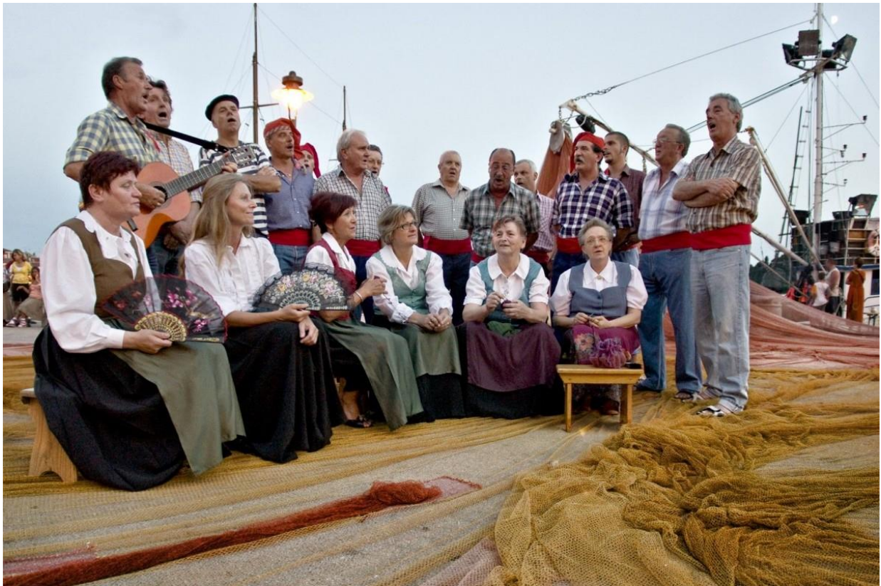
Slika 9. Rovinjska bitinada