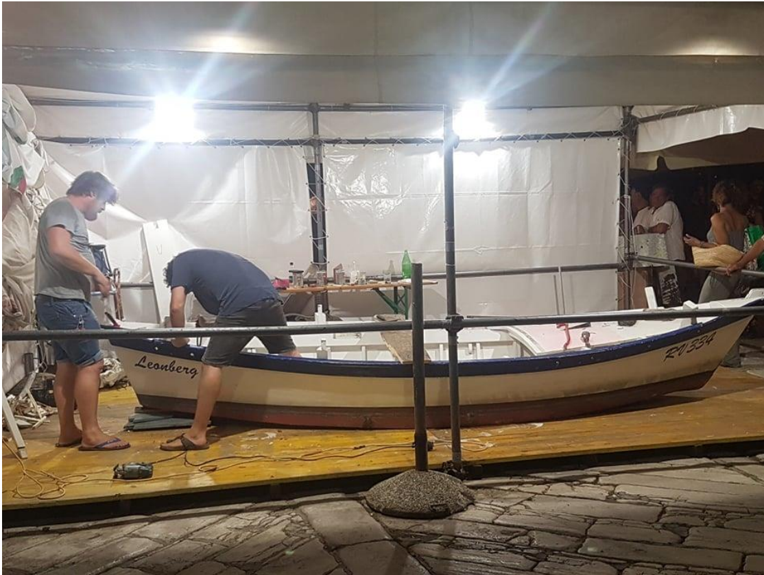
Slika 13. Izgradnja rovinjske batane

otvoren je spacio, riječ je o večerama na koje idu ribari i poljoprivrednici sa svojim batanama. Na večerama se jede riba koja se ulovi s batanama, te se kuša ostala rovinjska gastronomija, koriste jezik i dijalekt ali i svira narodna glazba. Spacio se održava nekoliko puta tjedno, ovisi o potražnji. U ljetnim mjesecima također se održava i regata glavnog jedra, događaj na kojemu se okupe sve brodice slične batanama s istom tipologijom jedra koje turisti mogu razgledati. Osim toga, za upoznavanje s tradicijom batane se animiraju, prave se mnoge radionice s djecom u vrtiću i školama, te se izrađuju makete.