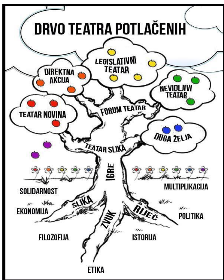
Slika 2 Drvo teatra potlačenih

U radu kazališta potlačenih sudjelovalo je mnogo različitih grupa ljudi, pa su se samim time razvijale različite i njegove tehnike. Te se tehnike mogu prikazati i slikovito u formi stabla gdje su slike, zvukovi i riječi korijenje; igre, Teatar slika i Forum teatar čine deblu, a ostale tehnike – Legislativni teatar, Direktna akcija, Nevidljivi teatar, Teatar novina, Duga želja – predstavljaju grane. ( http://www.okvir.org/forum-teatar-tehnika-teatra-potlacenih/ )