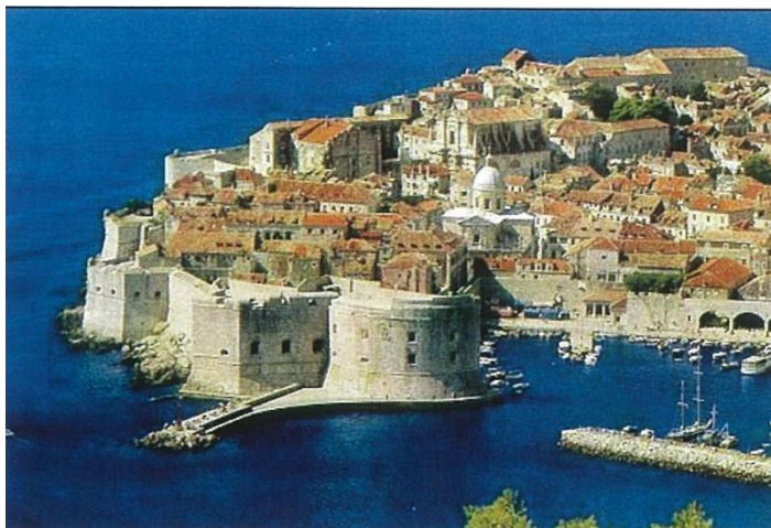
Utvrde na ulazu u dubrovačku luku

Rat između Mletačke Republike i ugarsko-hrvatskoga kralja Ludovika je završen te 1358. kada je potpisan Zadarski mir koji je i službeno označio kraj vrhovne vlasti Venecije nad Dubrovnikom. Tada je Dubrovnik postao slobodnim gradom s jakom trgovačkom flotom, dobro utvrđen, izvrsnom diplomacijom i s velikim ugledom. Unatoč vrhovnoj vlasti ugarsko-hrvatskog kralja, Dubrovnik vodi samostalnu politiku prema Mlecima i vojvodi Hrvoju Vukčiću Hrvatiniću što pokazuje njegovu moć početkom petnaestog stoljeća. 28