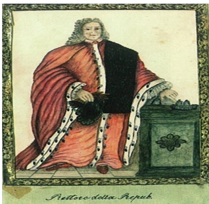
Knez Dubrovačke Republike

Ovakvim ustrojem političkih tijela u Dubrovniku sprječavao se i ograničavao utjecaj moćnijih obitelji u Dubrovniku. Sudstvo, koje je bilo vrlo bitan element dobrog funkcioniranja društva, ostalo je pod nadzorom Senata i Malog vijeća s knezom na čelu. Dubrovačka vlastela je obavljala sve funkcije u upravi i sudstvu države. Pučanima i građanima bile su dostupne samo manje važne službeničke dužnosti. Rijetki su bili slučajevi gdje bi se povjerila poneka diplomatska misija ili konzularna funkcija običnim pučanima ili građanima.