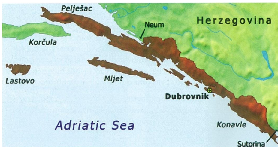
Cjeloviti državni teritorij Dubrovačke Republike

Temeljne odrednice i načela dubrovačke vanjske politike su inzistiranje na dobroj informiranosti, vrlo dobre analize i procjene vanjskopolitičkih odnosa, oprez u donošenju odluka te svijest o vlastitim mogućnostima i potencijalima. Vlada je nastojala ostvariti ravnotežu između svojih interesa i realnih mogućnosti, uvijek stavljajući na prvo mjesto prosperitet Republike. Jedno od glavnih načela dubrovačke vanjske politike bilo je izbjegavanje sukoba s drugim državama. Ako i nastane nekakav nesporazum ili konflikt, dubrovačka vlada je težila mirnom rješavanju otvorenih pitanja.