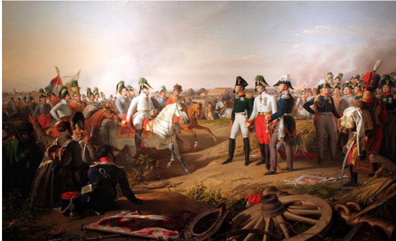
Slika 3. Prikaz Bitke naroda kod Leipziga 1813. Napoleona Bonapartea