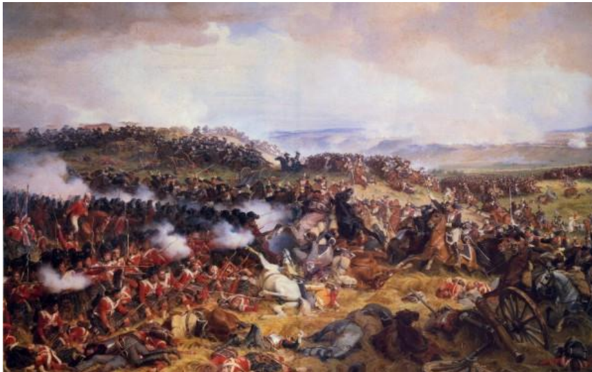
Slika 4. Prikaz bitke kod Waterlooa