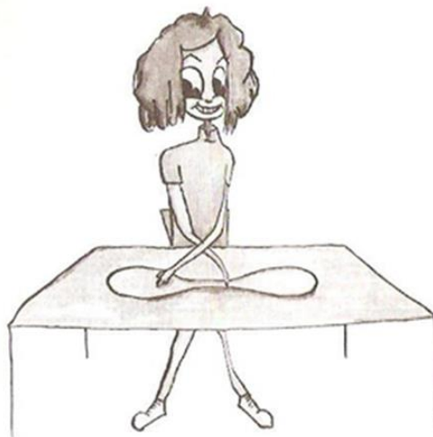
Slika 3. Taping rukom (Pejčić, 2005)

Ocjenjivanje: Izvedba traje 20 sekundi. Rezultat je broj uspješnih dvostrukih dodira u roku od 20 sekundi, ako nisu dotaknuta oba kruga mjeritelj to ne broji (Pejčić, 2005).