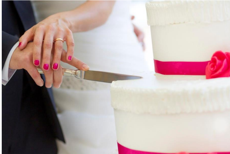
Slika 8: Rezanje mladenačke torte

se i pričekati dva, tri dana. Posjetitelji donose mladenkinim roditeljima ili svim članovima obitelji poklone, uglavnom pića ili hranu (npr. slatku rakiju, tortu, pečenku). 12