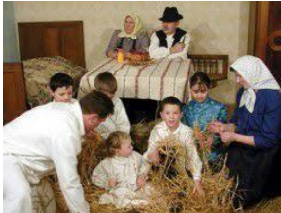
Slika 9: Prostiranje slame na Badnjak

zoru, kako bi svi poslovi u kući bili završeni do večernjeg crkvenog zvona, nakog kojeg domaćin kuće poziva sve na objed. U prostoriji u kojoj se objeduje ranije je rasprostranjena slama (sl. 9.). Također, postoji običaj da se na Badnjak daruje prvo muško dijete. U zoru dječaci obilaze susjedne kuće i selo u tzv. „položaj“. Koji od njih poželi domaćinu najviše obilje u novoj godini tom se daje najveća kobasica i slatkiši. Prije večernje mise, tijekom večeri, cijela obitelj se zajedno moli. 14