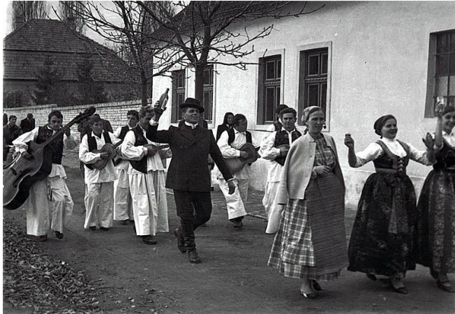
Slika 5: Tradicionalne zaruke

slijedi organizacija i priprema vjenčanja. To je prilika za oživljavanje starih i novih običaja, prigoda za gostoprimstvo, užitak, zabavu i ples. 8