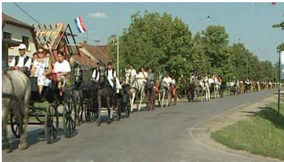
Slika 7: Povorka u kolima na putu prema crkvi

mladoženjom i njegovom obitelji, a danas nastavljaju mladenka i mladoženja živjeti sami i osnivaju vlastite obitelji. Nakon vjenčanja putuju zajedno na „medeni mjesec“. 11