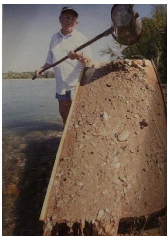
Slika 10. Tehnika ispiranja zlata

Amalgamacija je obuhvaćala završni postupak obrade zlata. Naime, u ovom se postupku koristila živa, kako bi se zlatne čestice međusobno povezale. U manju posudu bi se stavila živa s vodom te bi se dodala zlatna zrnca, nakon čega bi se zdjela pomicala tako dugo, dok se sva zrnca ne bi sjedinila. Potom bi se živa filtrirala pomoću lanene krpe, koja bi se omotala okolo amalgama i zategnula špagom. Na samom kraju bi se oblikovana kuglica zagrijala na visokoj temperaturi što bi otopilo živu te bi ostala samo kuglica od zlata što je ujedno bio i gotov proizvod.