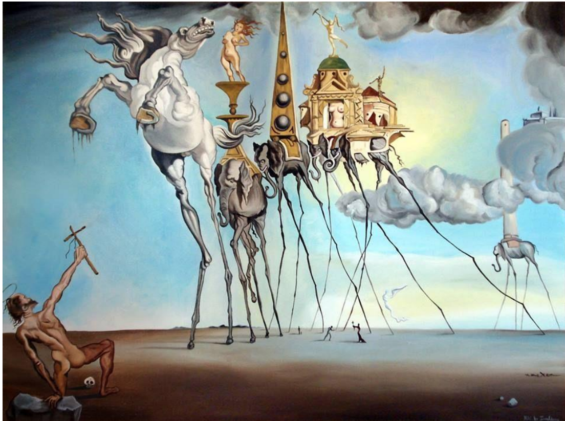
Slika 12. Iskušenje Sv. Antuna. Ulje na platnu, 1946.

( https://i.pinimg.com/originals/a4/da/d3/a4dad3ba556809e7888356a7acc2abaa.jpg , 25.07.2020.)