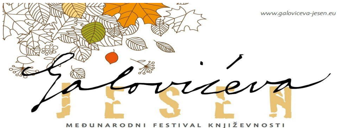
Slika 4.2. Naslovna strana festivala Galovićeva jesen 17

Prema podacima preuzetima sa internetske stranice o tom festivalu, Galovićeva jesen 16 književni je festival koji se svake godine održava u Koprivnici krajem mjeseca listopada u spomen Galovićeve smrti 26. listopada 1914. godine. Festival se održava već dvadeset devet godina. U sklopu festivala održavaju se razni književni susreti na kojima nastupaju mnogi poznati i manje poznati književnici, organiziraju se javna čitanja, predstavljanje knjiga, razne predstave. 2018. godine festival Galovićeva jesen imao je obilježje internacionalnog festivala književnosti zbog velikog odaziva pisaca i književnika iz Njemačke, Australije, Mađarske, Bosne i Hercegovine i drugih zemalja. Do 2011. godine Galovićeva jesen bila je književna manifestacija koja je od te godine prerasla u međunarodni festival književnosti zbog sve veće zainteresiranosti književnika i umjetnika iz stranih zemalja. Također se od 1997. godine dodjeljuje i Nagrada „Fran Galović“ za knjigu zavičajne tematike. Ove godine, Galovićeva jesen počinje u srijedu, 21. listopada 2021. godine i traje do subote, 24. listopada 2021. godine te su neki od važnijih događanja predstavljanje knjige Mapiranje dobitaka Matije Ivačića, Mali Galović , Galoviću u čast – recital poezije, Dok večer se zmračí – predstavljanje izabranih djela Frana Galovića i Završna svečanost i dodjela nagrada Fran Galović.