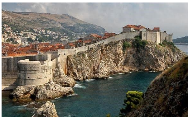
Slika br. 5 Dubrovačke gradske zidine

Utvrde grada s moćnim bedemima dužine 2 km, visine 25 m i 16 stražarskih kula okružuju riznicu arhitektonskih i kulturnih remek-djela savjesno sačuvanih tijekom stoljeća - poput franjevačkog samostana Dubrovnik - pogled na grad i luku obzidanu 14. stoljeća s jednom od najstarijih ljekarni u Europi ili katedralom sv. Vlaha, Gotičkom Kneževom palačom i dominikanskim samostanom koji su sagrađeni u 15. stoljeću. Užitek je prošetati uskim starim ulicama ili se zaustaviti u jednom od brojnih restorana i kafića koji pozivaju na odmor i uživanje u štihi grada i obilnoj, ukusnoj hrvatskoj kuhinji. Ako hodate po bedemu oko grada i penjete se na kule tvrđava, uživat ćete u panoramskom pogledu na stari grad sa zidinama i drevnim krovovima, luku i slikovito okruženje. Drevni grad Dubrovnik s brojnim povijesnim spomenicima 14. i 15. stoljeća nalazi se na UNESCO-vom popisu svjetske kulturne baštine.