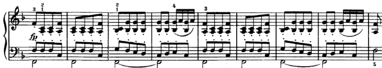
Slika 4.2.11. Druga tema u osnovnom tonalitetu

Nakon mosta slijedi razrada tematskog materijala iz prve teme, što nas dovodi do nastupa druge teme, ovaj put u osnovnom tonalitetu (F-dur) (Slika 4.2.11.).