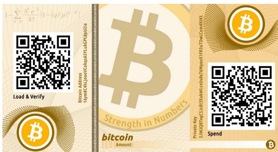
Slika 2 - Primjer Bitcoin-a tiskanog na papiru: s prikazom adrese (lijevo) i privatnog ključa (desno) 41

Svaka bitcoin adresa i pripadajući privatni ključ su međusobno povezani na način da je adresa rezultat određene kriptografske funkcije provedene nad privatnim ključem. Znači da znajući adresu ne možemo utvrditi privatni ključ, ali znajući privatni ključ, možemo utvrditi adresu odnosno račun vlasnika primjenom odgovarajuće funkcije, odnosno služeći se javno