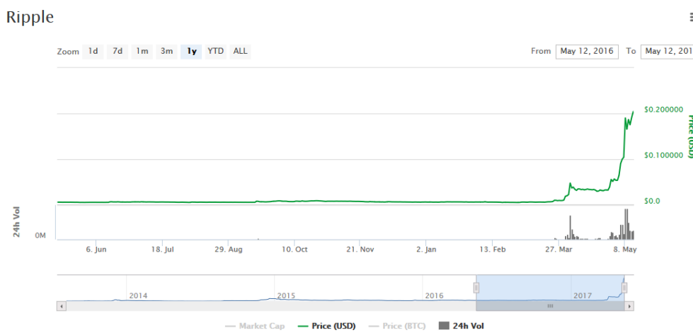
Slika 6 - Prikaz kretanja cijene zadnjih godinu dana - Ripple 76

Na dan 31.8.2016. udio Bitcoina u tržišnoj kapitalizaciji iznosio je 81%. 77 Na dan 31.3.2017. je udio Bitcoina 67%. 78 Očiti je jači trend rasta alternativnih valuta u odnosu na Bitcoin. U 2014. godini, nove altcoin valute su se stvarale gotovo svaki dan, s brojem od 69 u siječnju 2014. do 590 u prosincu 2014. Rast u aktivnih altcoina je usporen do lipnja 2015. tako da se broj aktivnih valuta od tada kreće između 650 do 770.