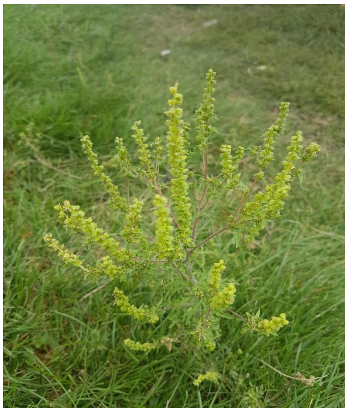
Slika 3. Ambrosia artemisiifolia L. (ambrozija)

Ambrosia artemisiifolia L., jednogodišnja zeljasta biljka prikazana je na slici 2. Jedna je među najpoznatijim invazivnim alohtonim biljnim vrstama i svrstavamo je u porodicu Asteraceae (glavočike) (Ministarstvo kulture, 2009).