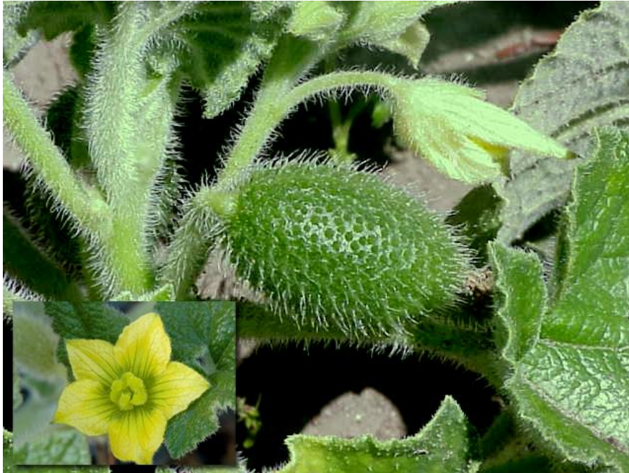
Slika 8. Echinocystis lobata (Michx.) Torr. et Gray (divlji krastavac)

Pripadnik porodice Cucurbitaceae , podrijetlom je iz Sjeverne Amerike. Ova jednogodišnja penjačica prikazana na slici 8. krajem 19. stoljeća namjernim putem je unesena u Europu kao ukrasna i ljekovita biljka.