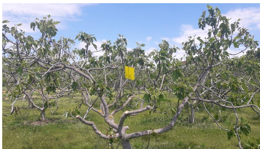
Slika 3. Žute ljepljive ploče