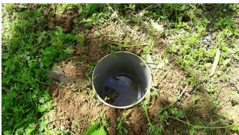
Slika 2. Lovne posude (pitfall traps)

do jedne trećine i u svaku je dodano 50 ml alkohola (70 %-tni etanol). Otresanje grana je provedeno pomoću entomološke mreže promjera 40 cm na 33 nasumično odabranih grana stabala iz svakog dijela nasada. Postupak otresanja se provodi sa 3 snažna i brza udarca što uzrokuje padanje kukaca u mrežu. Uzorkovanje lovnim posudama je obavljeno 3 puta mjesečno, otresanje grana je provedeno 2 puta mjesečno, dok su žute ploče pregledavane svakih 7 dana. Pokus je trajao 4 mjeseca (svibanj-kolovoz). Skupljeni uzorci su čuvani u zamrzivaču na temperaturi 0 °C. Svi uzorci su zatim pregledani pod binokularnom lupom i determinirani do razine reda, a gdje je moguće i do porodice. Determinacija je obavljena pomoću entomoloških ključeva (Schmidt, 1970.)