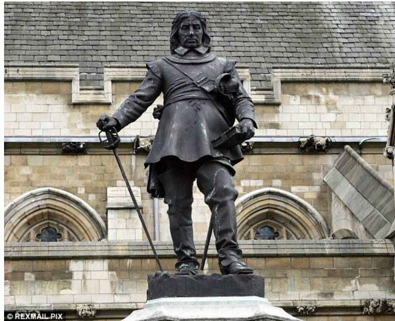
Bild 2: Oliver Cromwell's Statue außerhalb des Parliamentshauses in Westminster, London

ein jüdisches Vorhaben ist. Oliver Cromwell (Bild 2) war der erste der auf diese Idee kam, und seine theologischen Nachfolger in Britannien und den Vereinigten Staaten haben die Idee (sehr erfolgreich) weitergetragen, weswegen er rechtlich als der Vorvater der zionistischen Bewegung beschrieben sein sollte. Die Bewegung die er gegründet hat, und seine Nachfolger weitergetragen haben, ist heute als christliches Zionismus 6 bekannt.