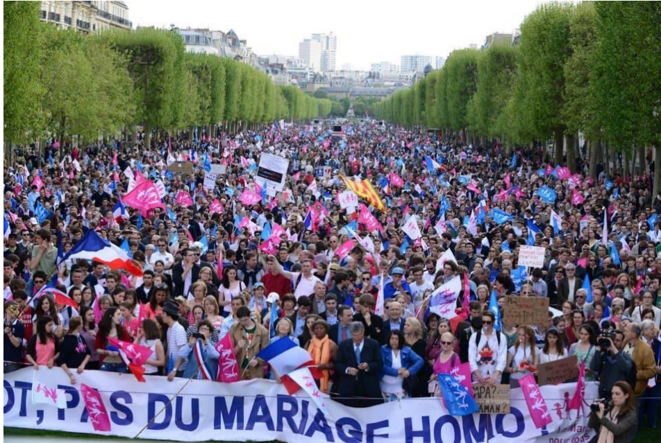
Slika 19. Prosvjed milijuna Francuza za zaštitu tradicionalnih vrijednosti (2013.)