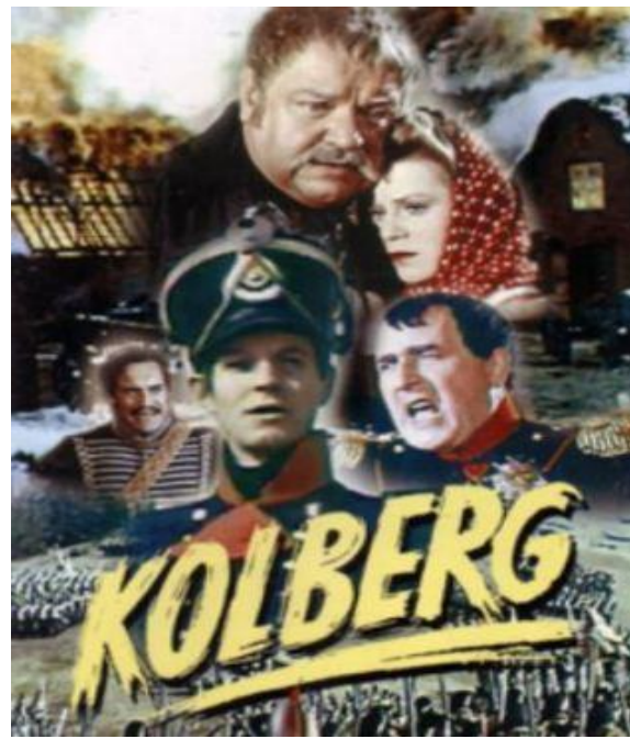
Slika 8. Poster filma Kolberg (1945.)