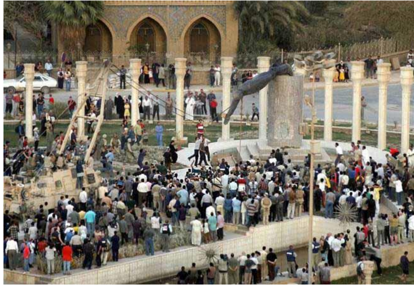
Slika 14. Rušenje Saddamovog kipa (2003.)