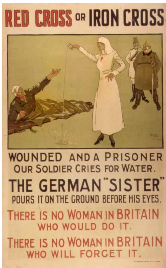
Slika 6. “Crveni križ ili željezni križ“