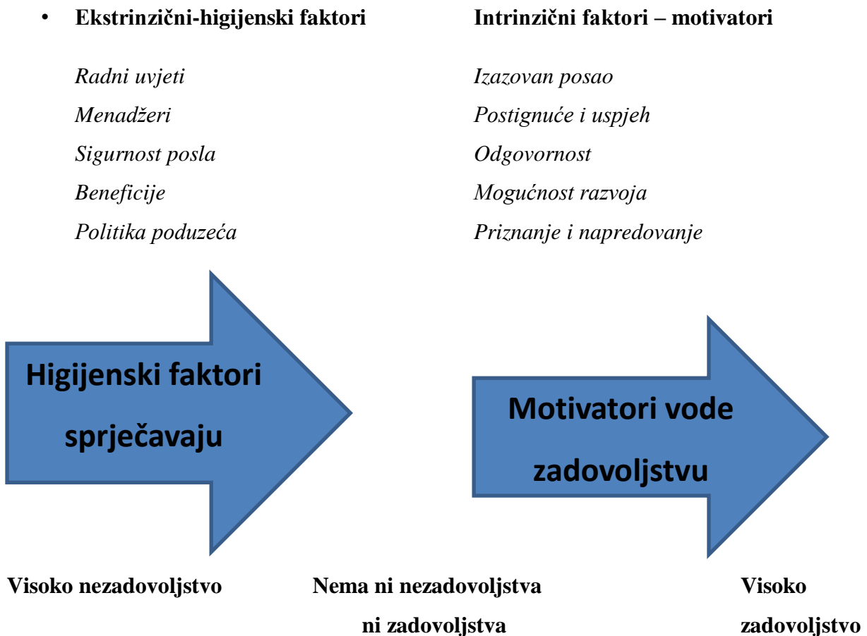
Slika 2. Herzbergova dvofaktorska teorija