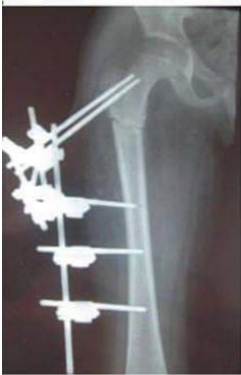
Slika 3. Rendgenski prikaz vanjske fiksacije zgloba kuka ( preuzeto sa: https://benthamopen.com/FULLTEXT/TOORTHJ-11-353/FIGURE/F1/ datum pristupa: 03.11.2018.)

Kod prijeloma kuka, pertrohanterni prijelom se liječi operacijski. Zbog vrlo visoke dobi pacijenata potrebna je potpuna prijeoperacijska priprema koja zahtjeva specifična znanja i vještine. Vrsta osteosinteze se odabire na temelju oblika prijeloma, biološke starosti bolesnika te njegove pokretljivosti prije prijeloma. Najčešće se koriste implantanti koji omogućavaju stabilnost prijelomne pukotine: kutna ploča, dinamička kompresivna ploča, gama čavao i proksimalni ukrivljeni čavao. (10) Na slici 4 prikazana je rendgenska snimka postavljenog gama čavla. Dan nakon operativnog zahvata započinje se sa mobilizacijom pacijenta radi sprječavanja postoperativnih komplikacija i komplikacija dugotrajnog ležanja.