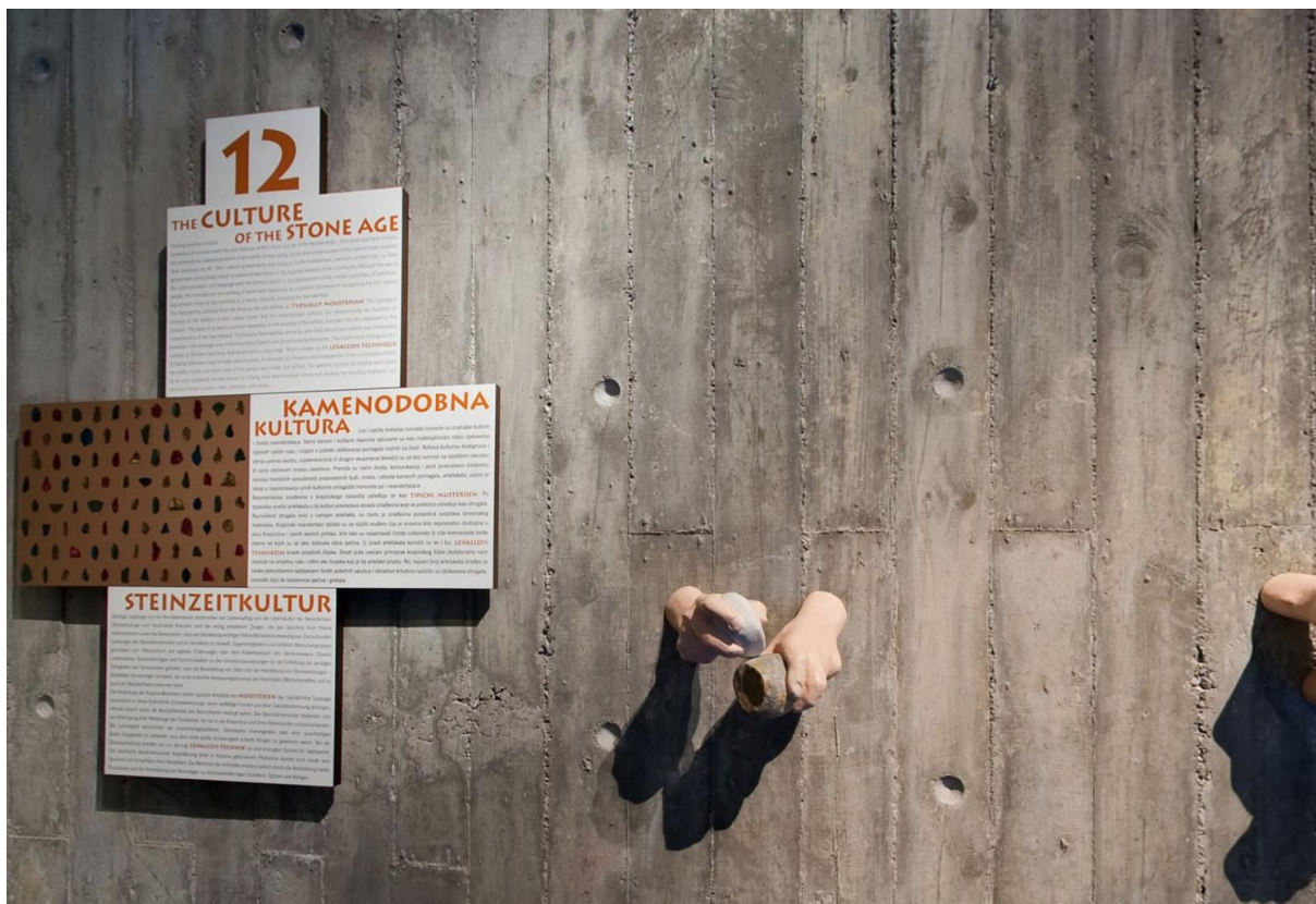
Abb. 3 Informationstafeln im Neandertalmuseum in Krapina

Aufgrund des mangelnden Platzes auf den Informationstafeln im Museum werden häufig Audioguides als Vermittler der ausführlicheren Informationen verwendet. In den nächsten Unterkapiteln wird der Audioguide im Kroatischen (AS) und Deutschen (ZS) anhand von den Übersetzungsstrategien und anderen Kriterien zum Aufbau des Audioguides analysiert.