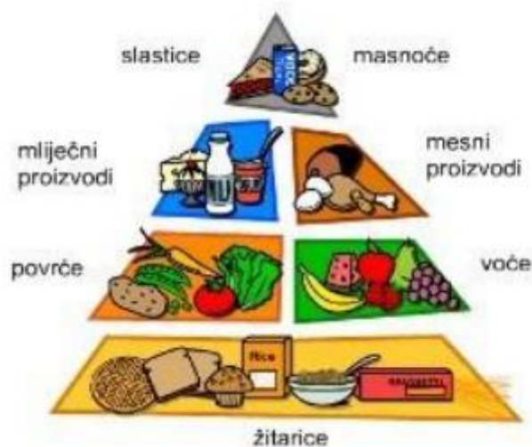
Slika 3. Piramida zdrave prehrane